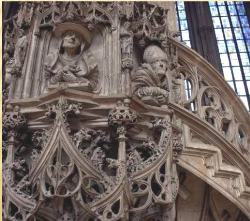
Резьба по камню XVI века

а. Резьба по камню - процесс придания камню требуемой формы и внеш. отделки при помощи распиловки, токарной обработки, сверления, шлифовки, полировки, гравировки (резцом, ультразвуком).