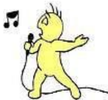
sing irregular verb