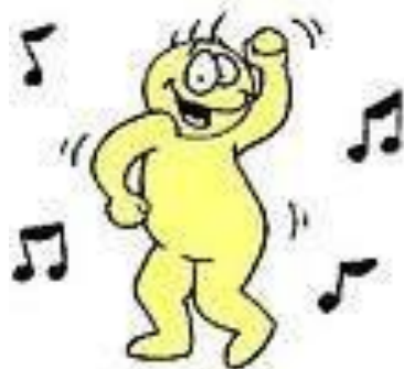
dance regular verb