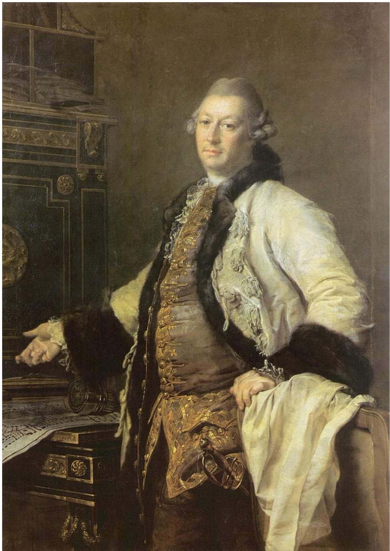
Портрет архитектора А. Ф. Кокоринова. 1769