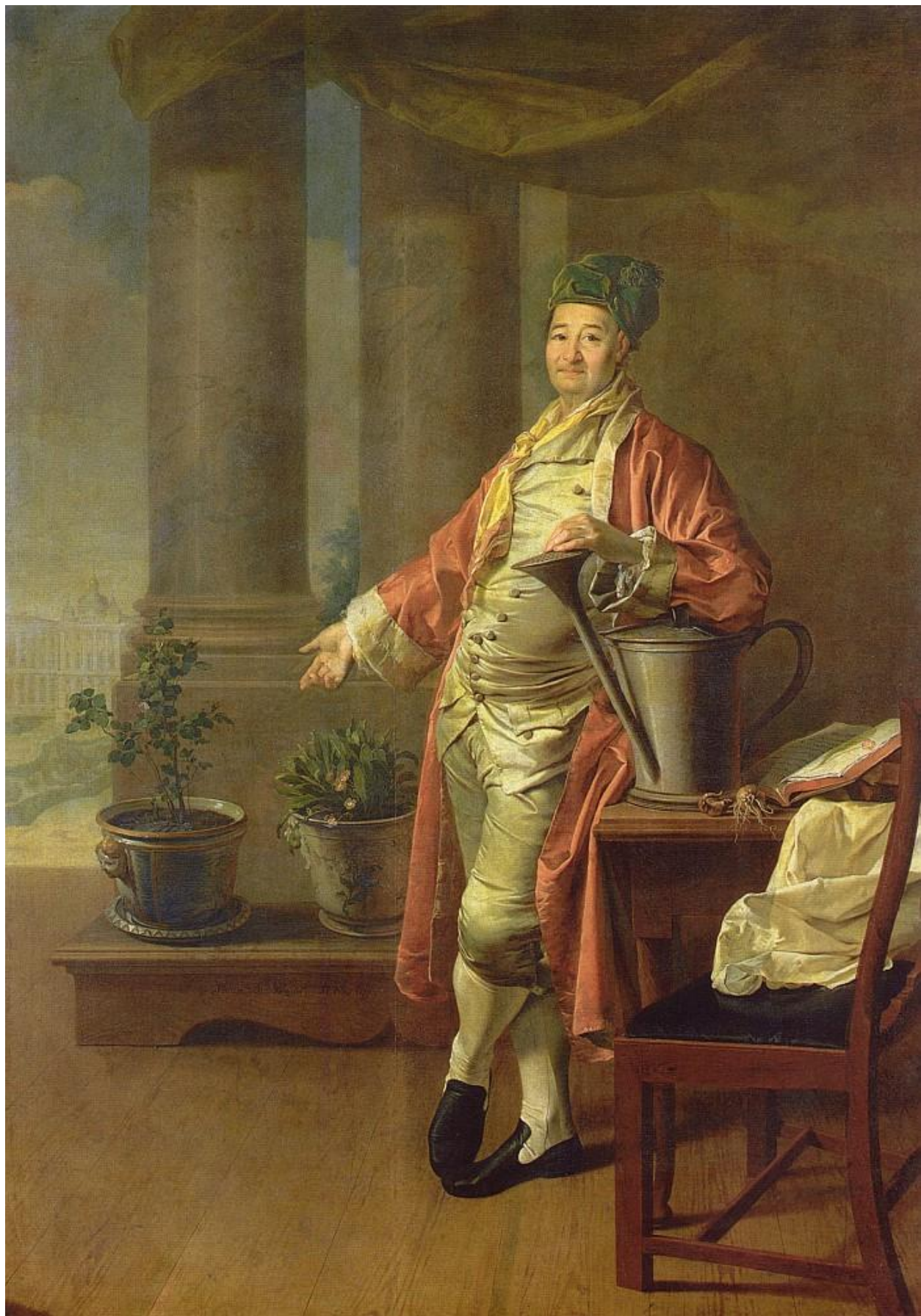
Портрет П. А. Демидова. 1773