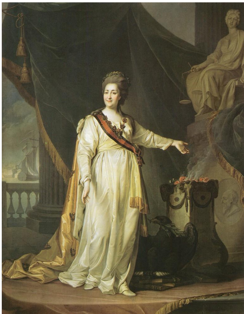
Портрет Екатерины II в виде законодательницы в храме богини Правосудия. 1783