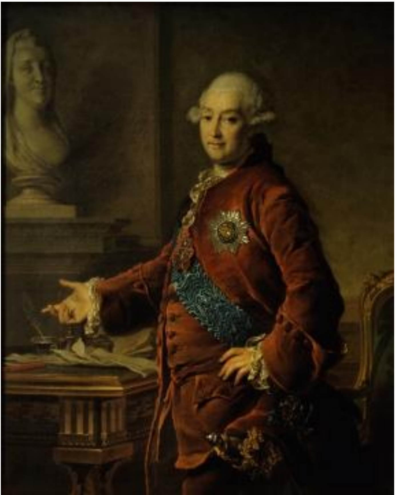
Портрет вице-канцлера князя А.М.Голицына.1772