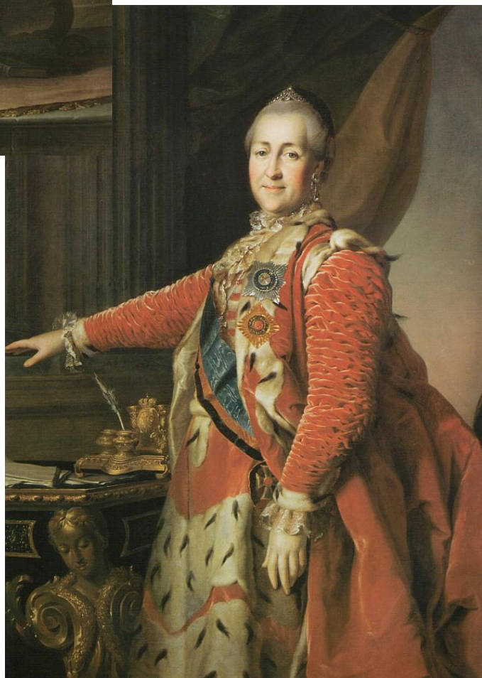
Портрет Екатерины II. Около 1782