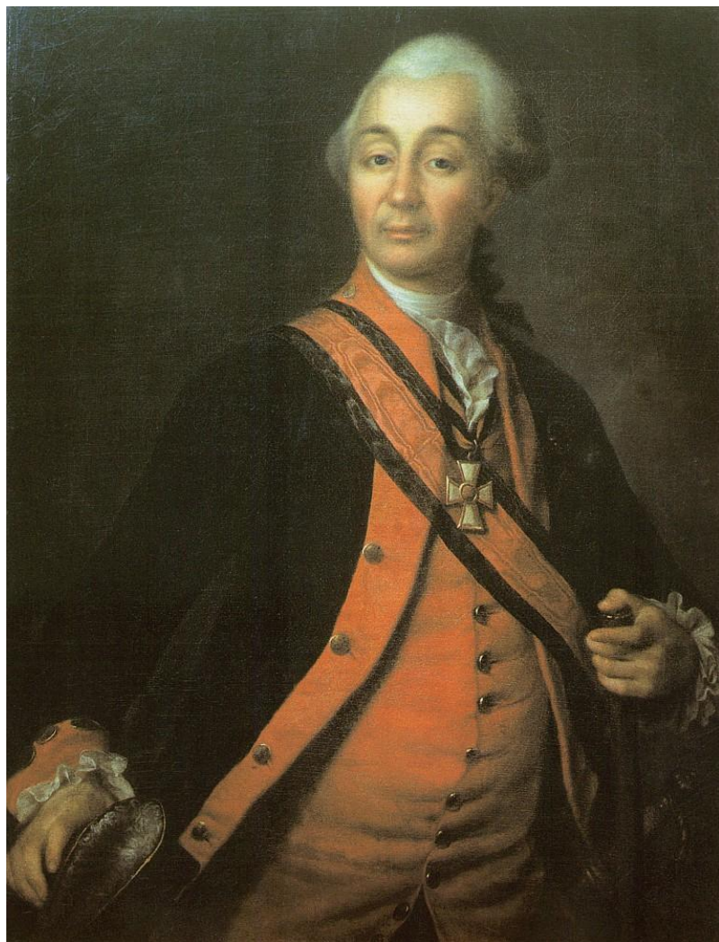
Портрет А. В. Суворова. 1786