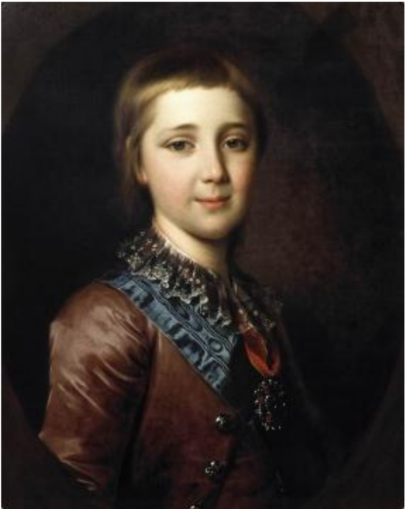
Портрет великого князя Александра Павловича в детстве