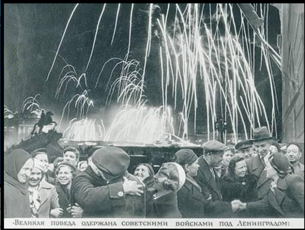
-ВЕЛИКАЯ ПОБЕДА ОДЕРЖАНА СОВЕТСКИМИ ВОЙСКАМИ ПОД ЛЕНИНГРАДОМ:

Победе радовалась вся страна, но эта радость была со слезами на глазах, так как в каждой семье, в каждом доме кто-то погиб на этой страшной войне. В нашей республике Беларусь, погиб каждый четвёртый житель.