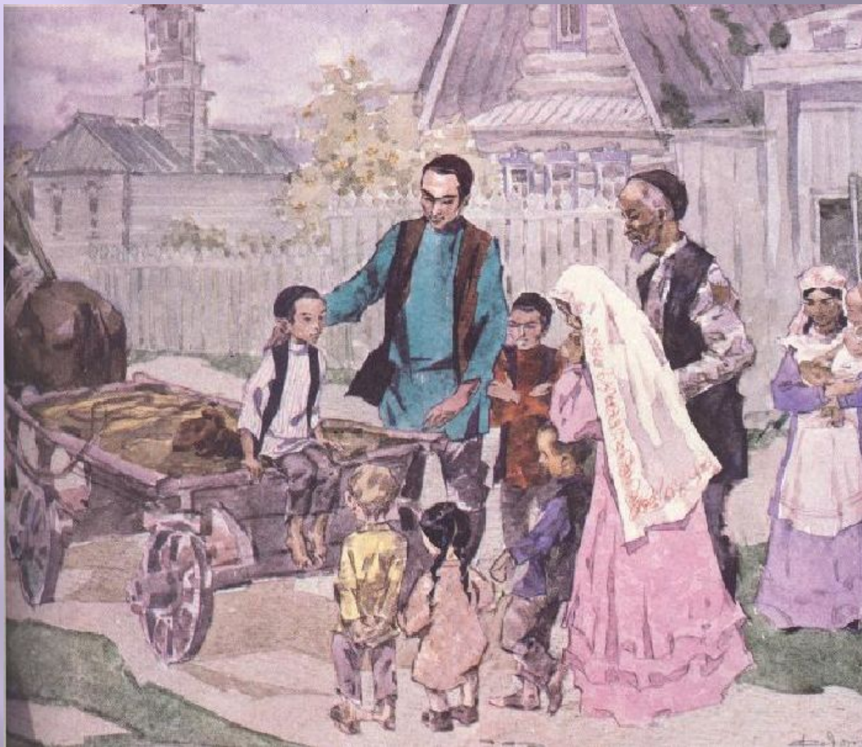
В.Федоровның “Тукайның Өчиледән Кырлайга килүе” картинасы. 1975 ел.