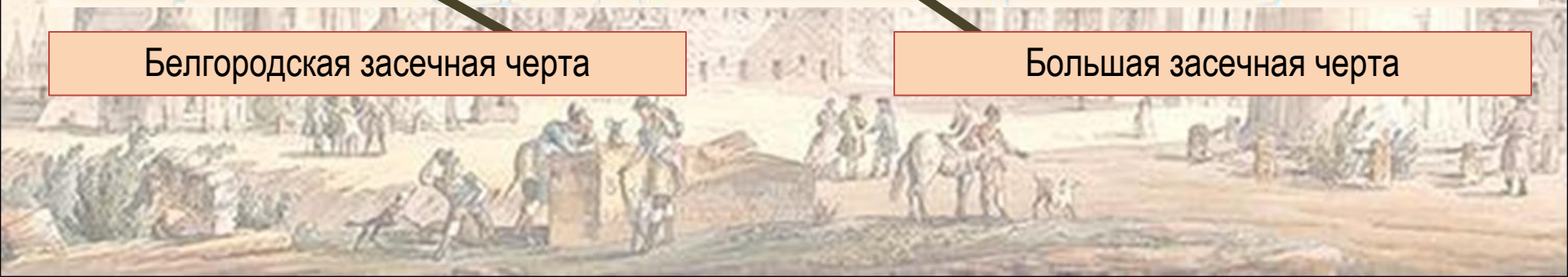
Большая засечная черта