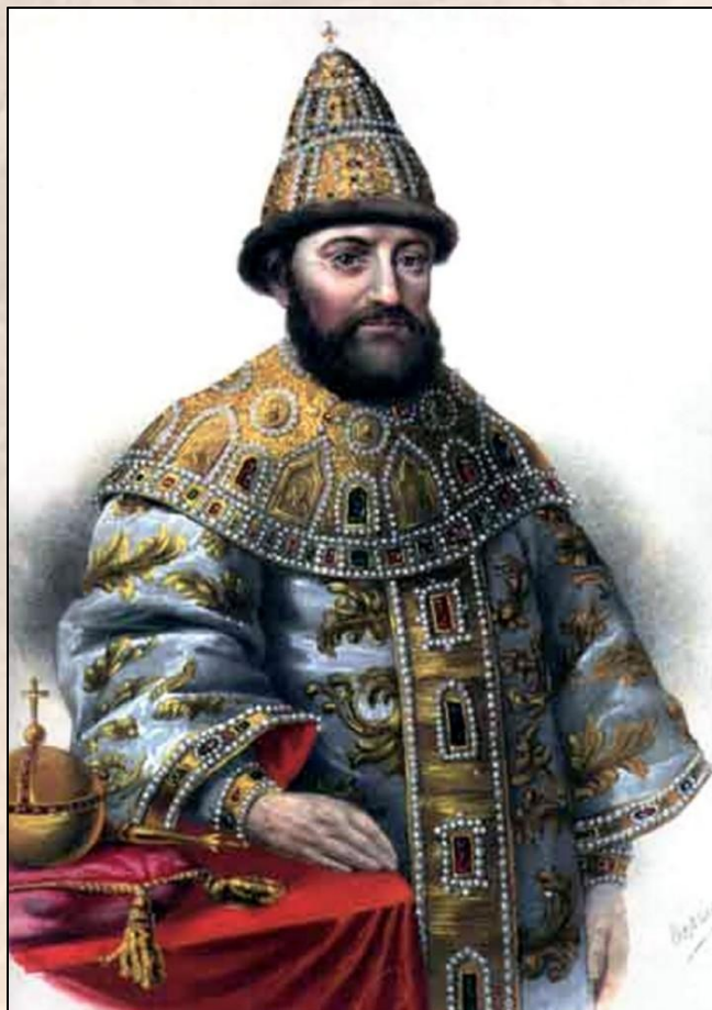
Царь Михаил Федорович

С 1619 до 1633 г. фактическим соправителем Михаила стал его отец патриарх Филарет (Федор)