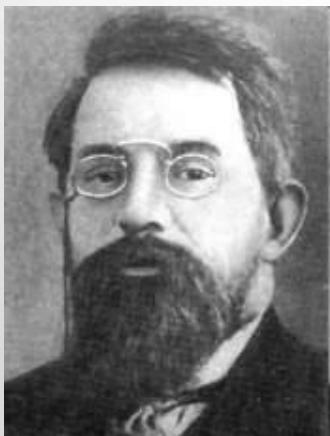
Пётр Бернгар- дович Струве