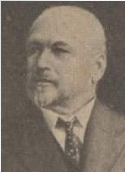
Михаил Владимирович Родзянко