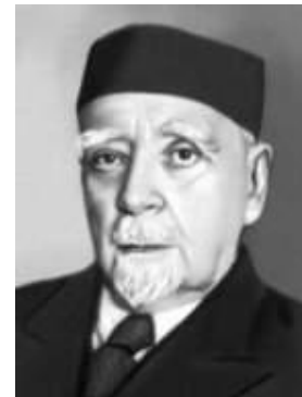
Глеб Максимилианович Кржижановский