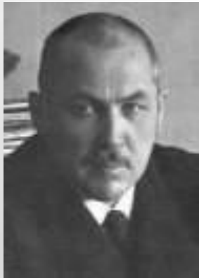
Николай Алексеевич Хомяков