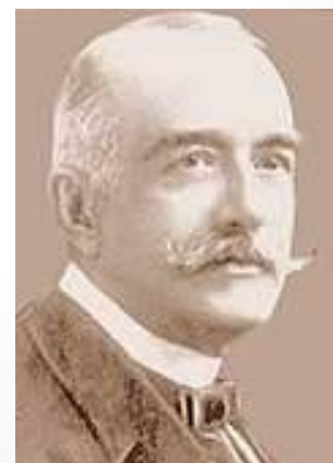
Сергей Андреевич Муромцев