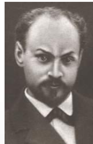
Григорий Андреевич Гершуни