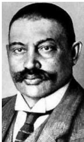
Евно Фишелевич Азеф