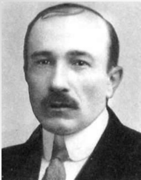
Борис Викторович Савинков