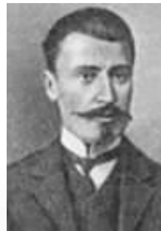
Ираклий Георгиевич Церетели