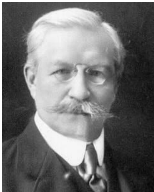
Павел Николаевич Милюков , председатель