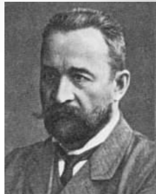
Князь Георгий Евгеньевич Львов