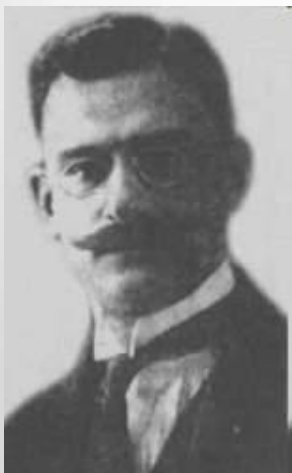
Николай Дмитриевич Авксентьев