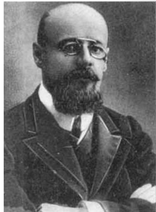
Владимир Митрофанович Пуришкевич