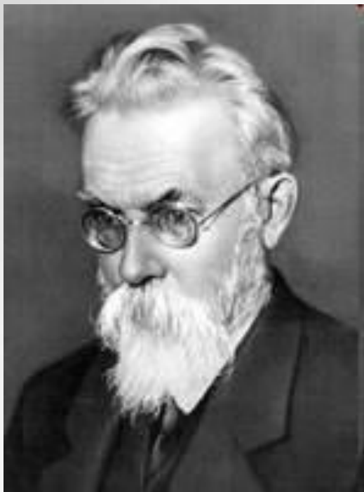
Владимир Иванович Вернадский