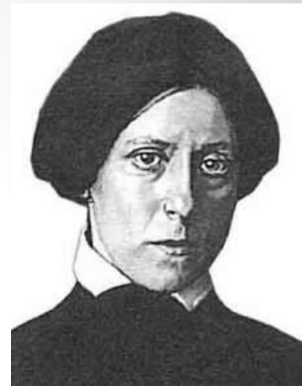
Мария Александровна Спиридонова