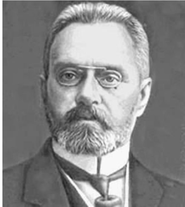
Александр Иванович Гучков , председатель