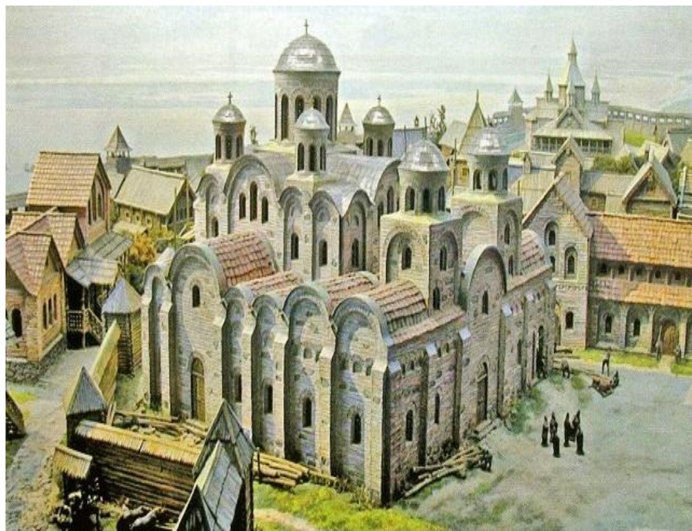
Десятинная церковь в Киеве. Художественная реконструкция