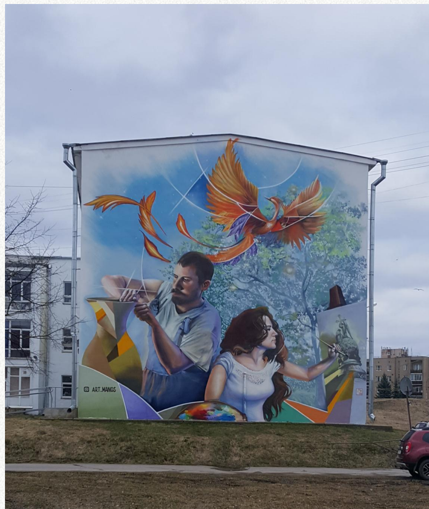
Великий Новгород, ул. Псковская, дом № 1, ДКМ «Город», торцевые фасады