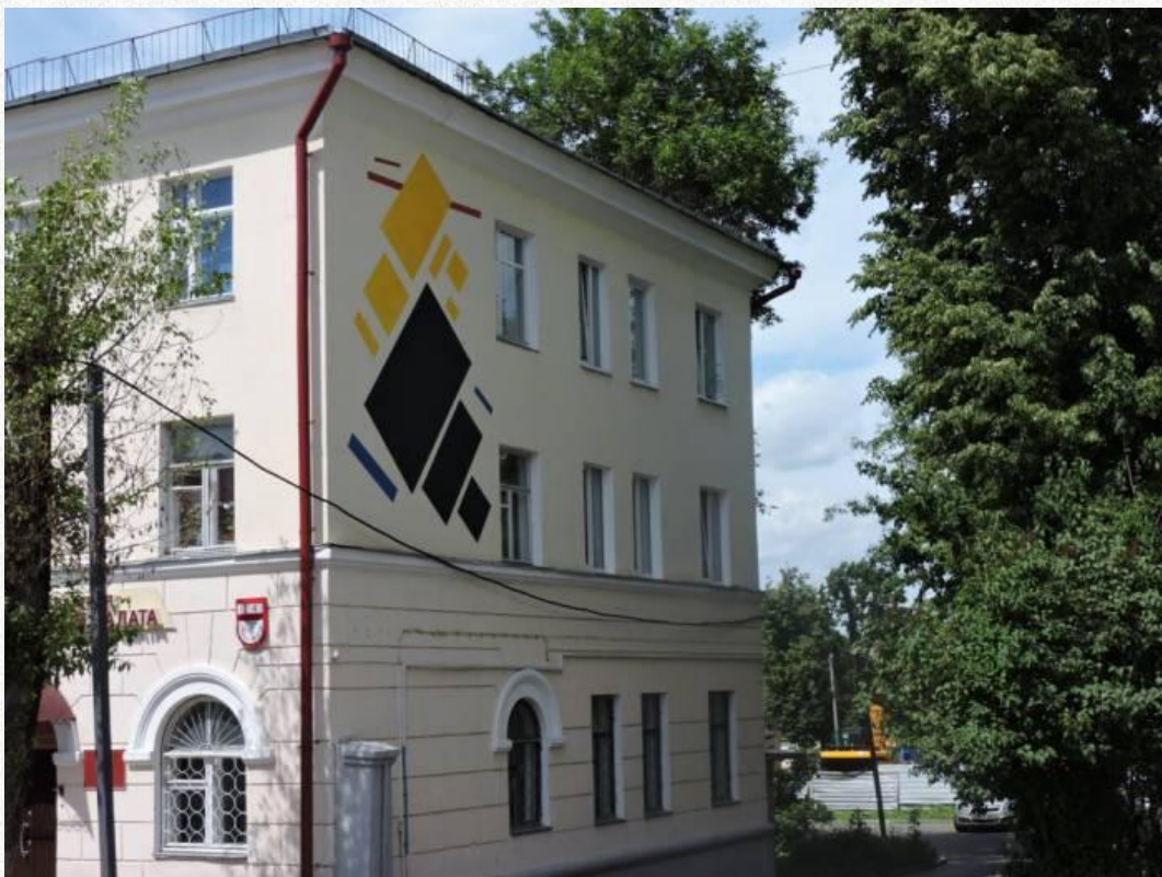
Супрематизм Малевича на улице Марка Шагала, г. Витебск, Беларусь