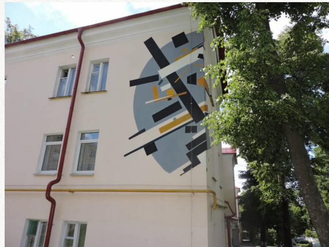
Просветительская – ознакомление людей с историей искусства простым наглядным способом; задача заключается в том, чтобы привлечь внимание к расширению собственного кругозора