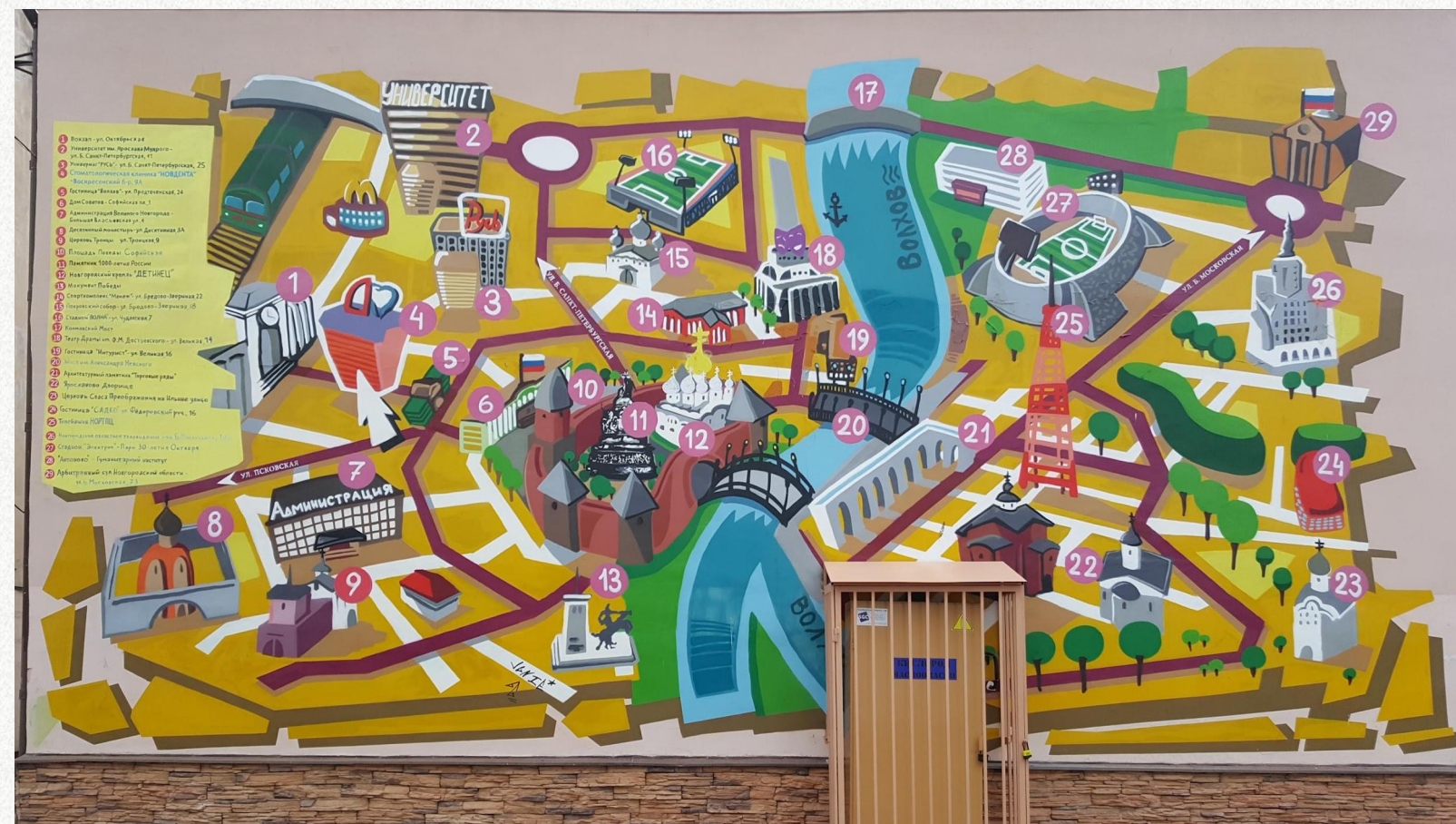
Великий Новгород, Воскресенский Бульвар, дом № 9а, восточный фасад