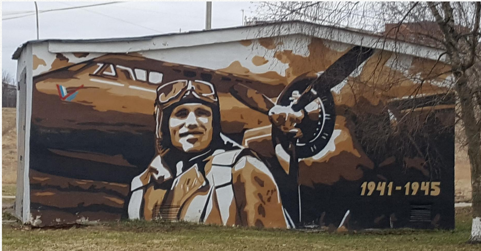
Великий Новгород, техническое помещение между ДКМ «Город» и Экономическим Институтом