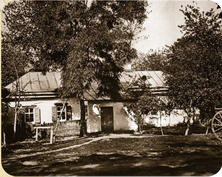
Дом, где родился Н.В. Гоголь.