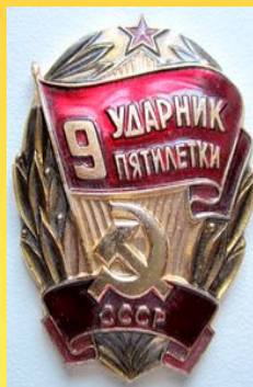
Знак «Ударник девятой пятилетки»