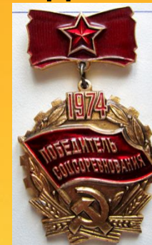
Знак «Победитель социалистического соревнования 1974 года»