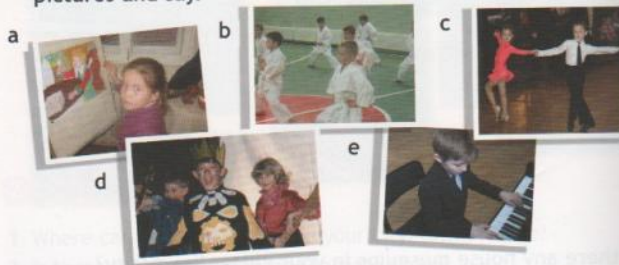
a She is in an art class. She's painting a picture.