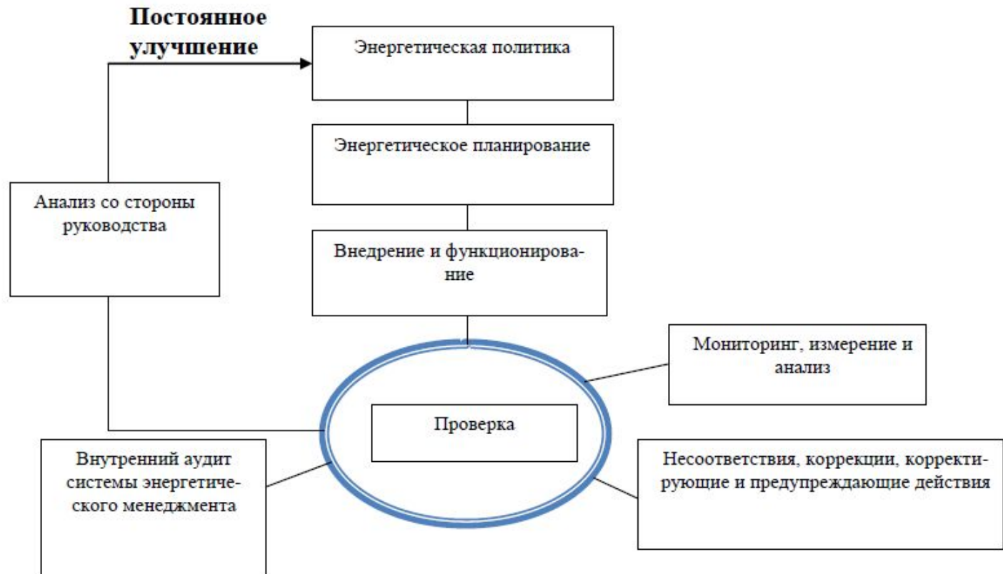
Модель энергетического менеджмента