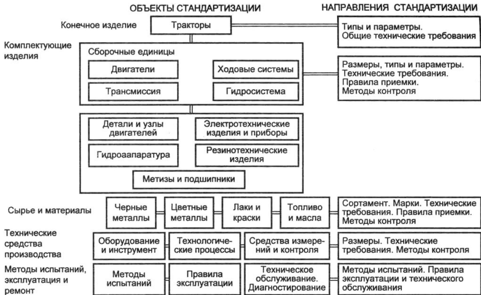
Рис. 1.2. Реализация программы комплексной стандартизации