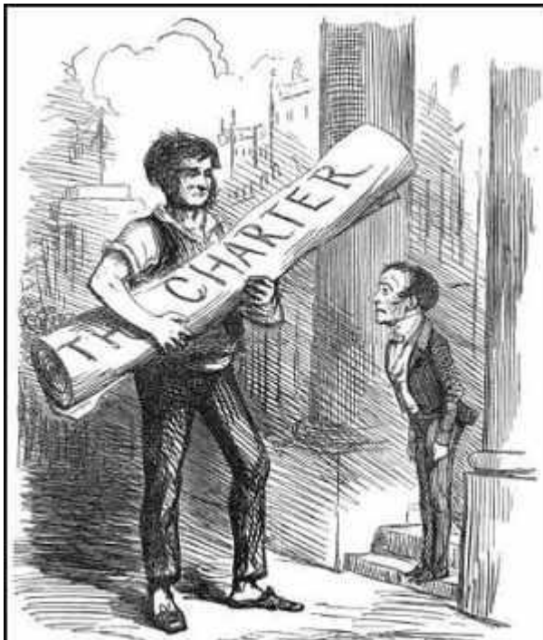
Рабочий с хартией