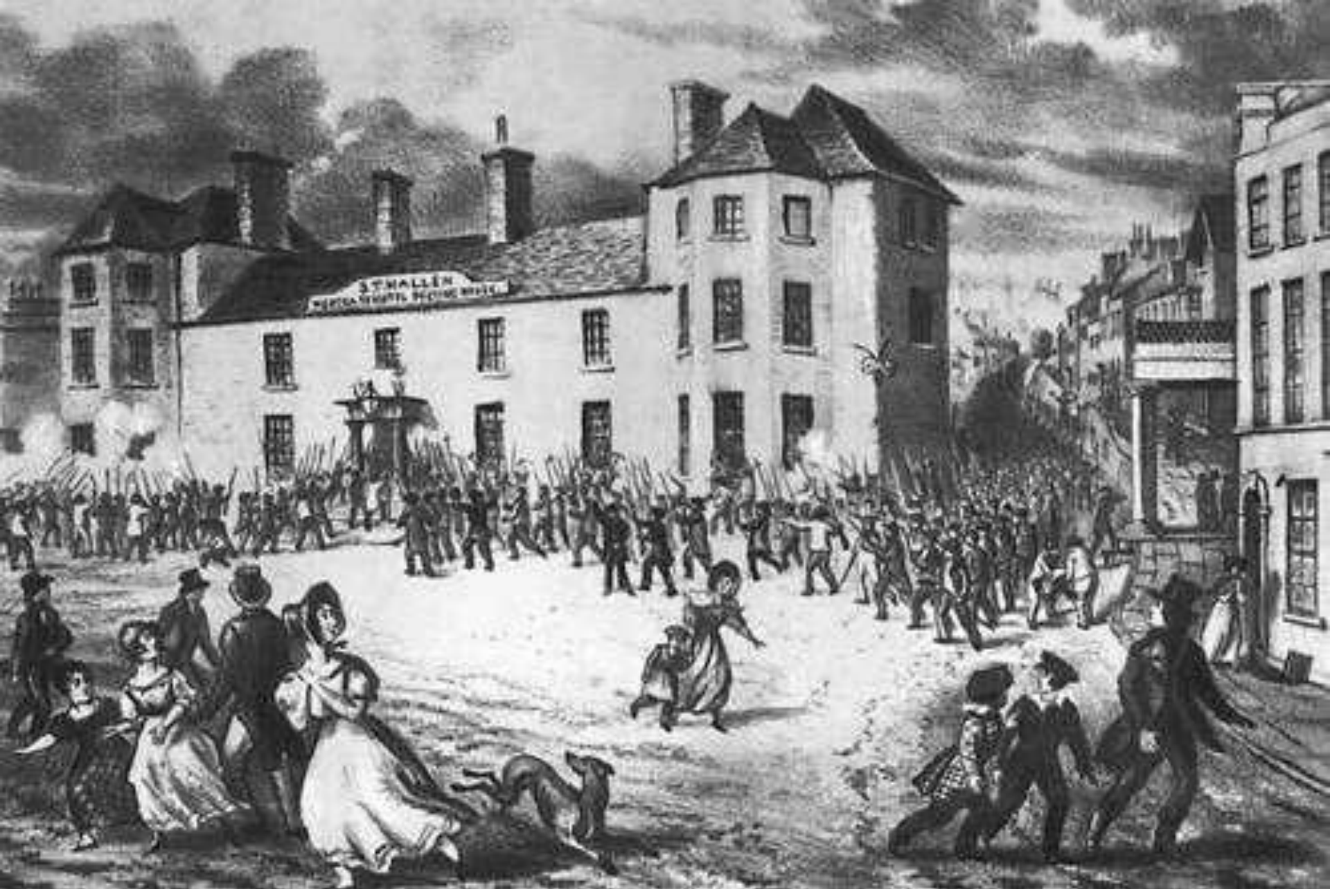
Восстание чартистов, 1839