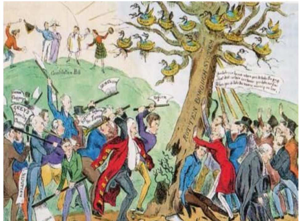
Ликвидация «гнилых местечек»