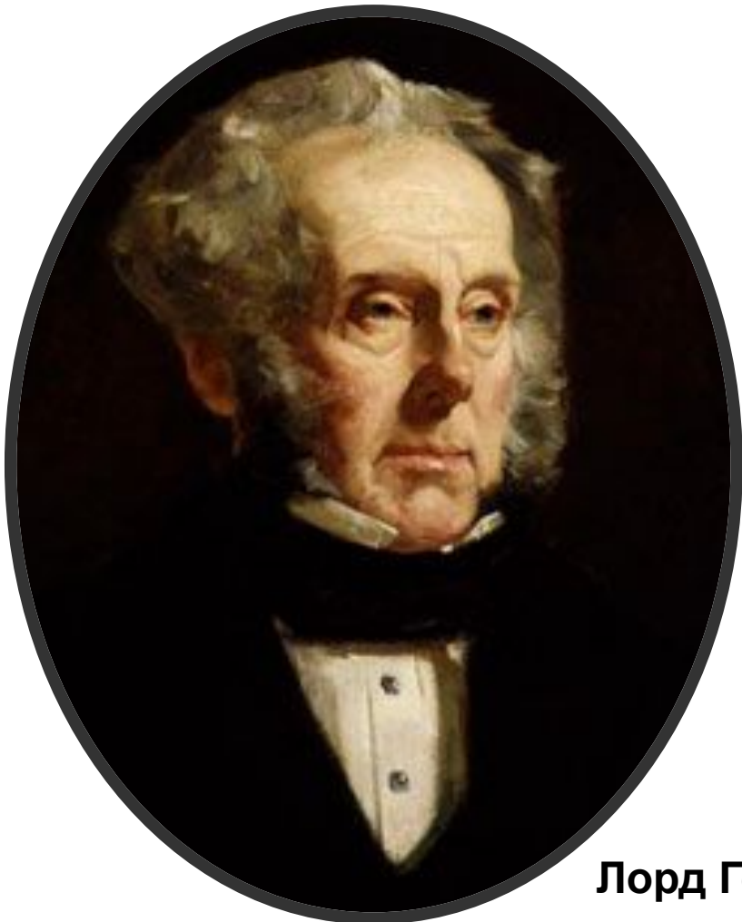
Лорд Генри Пальмерстон