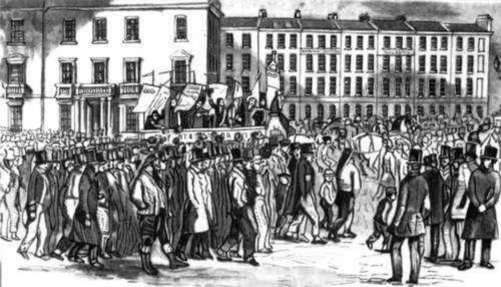
Чартистская демонстрация, 1848