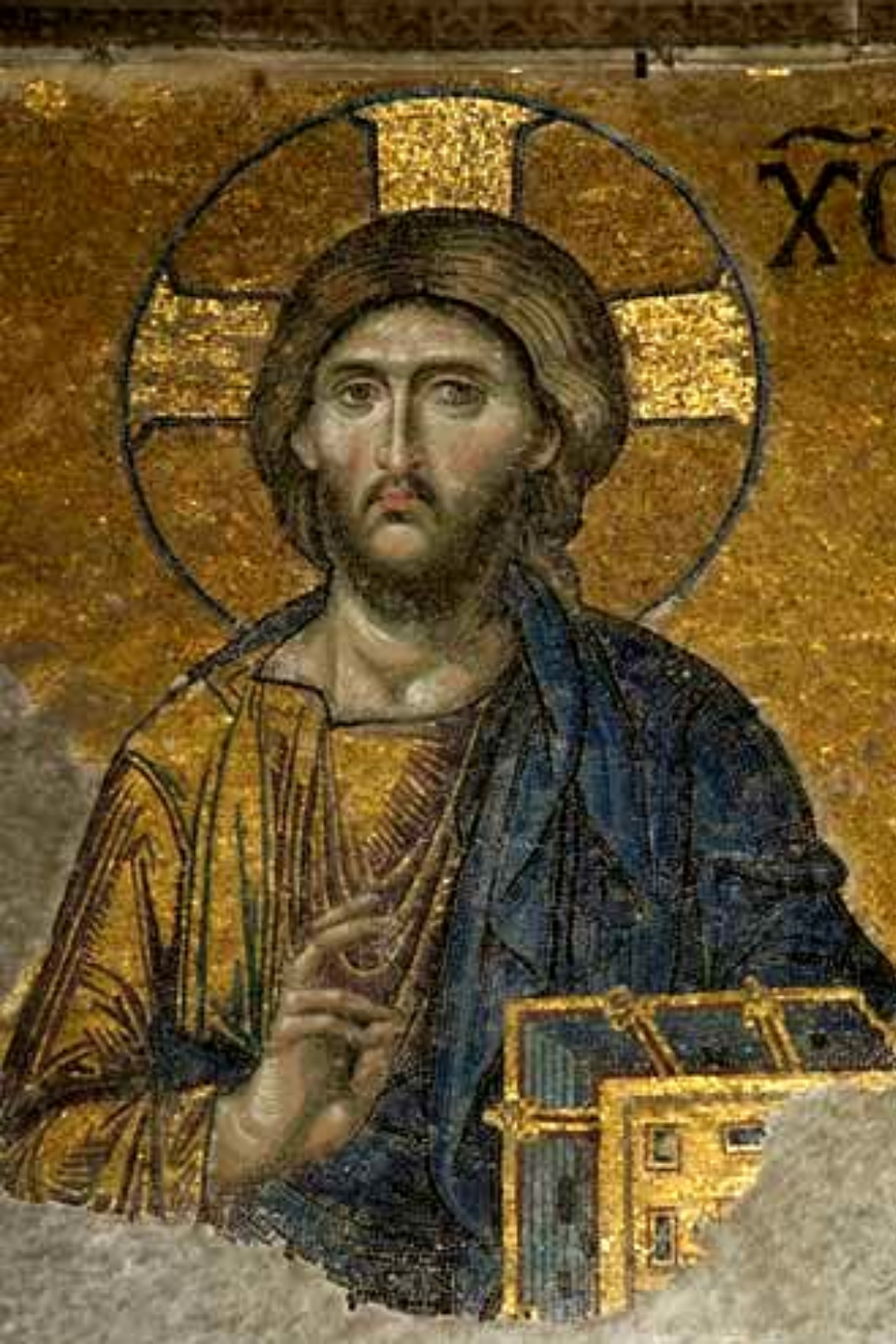
Христос- Пантократор. Мозаика в Софийском соборе Константинополя