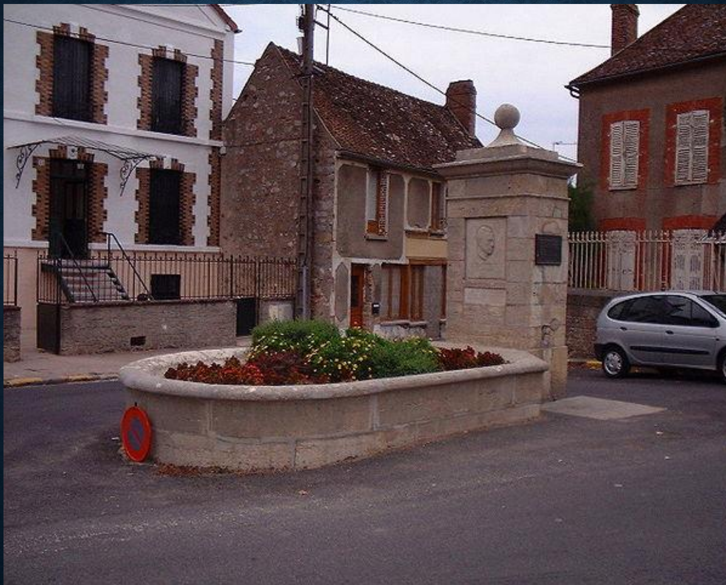
Памятник Камю в городе Вильблевен