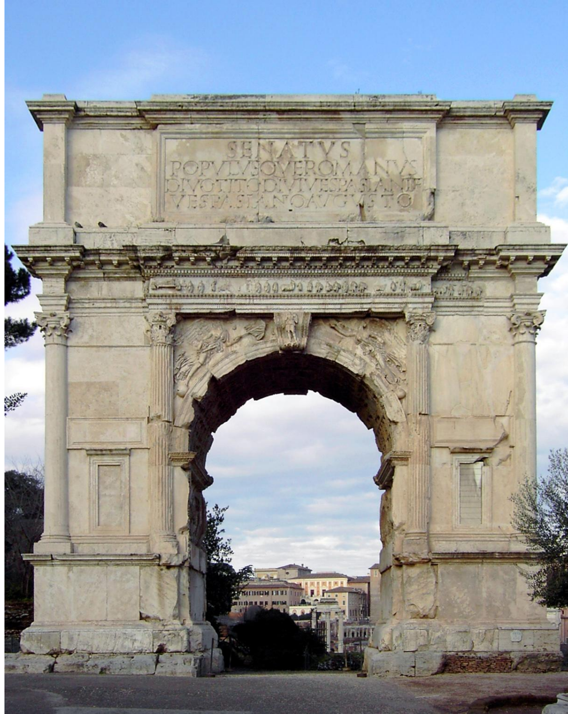
Триумфальная арка Тита 81 год