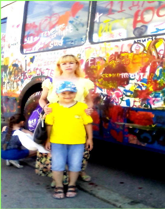
Праздник в городе