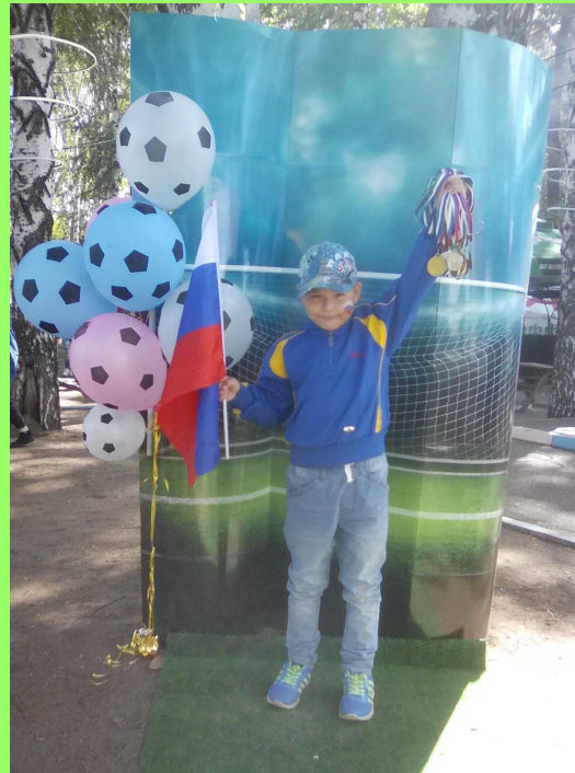
Праздник в городе