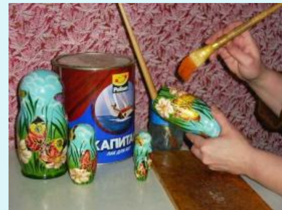
После раскраски лакируют