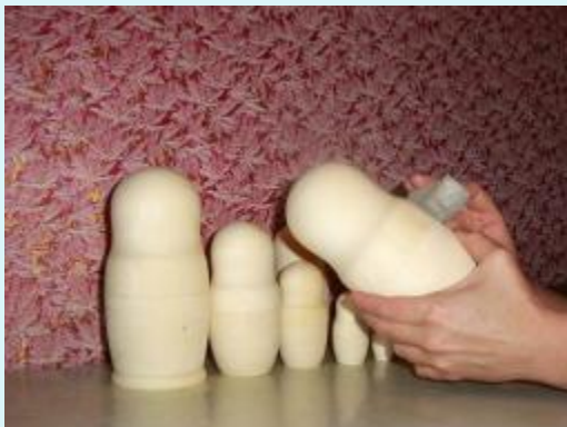
Деревянную матрёшку зачищают и грунтуют