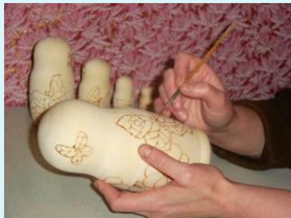
Основа рисунка выполняется карандашом