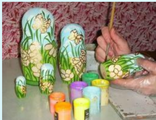
Расписывают гуашью, акварелью или акрилом