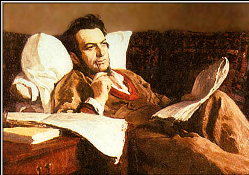
Mikhail Ivanovich Glinka (1803-1857)