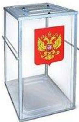
Опечатанный (опломбированный) стационарный ящик

Голосование может быть перенесено на более раннее время, если на территории проживают участники голосования, рабочее время которых совпадает со временем голосования