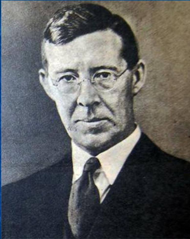
Питирим Сорокин 1889-1968 гг.

Ввел в социологию понятие « социальная группа » в начале XX века.