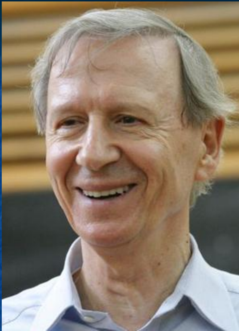
Энтони Гидднес 1938 г.

Социальная группа - некоторое число людей, взаимодействующих друг с другом на регулярной основе.