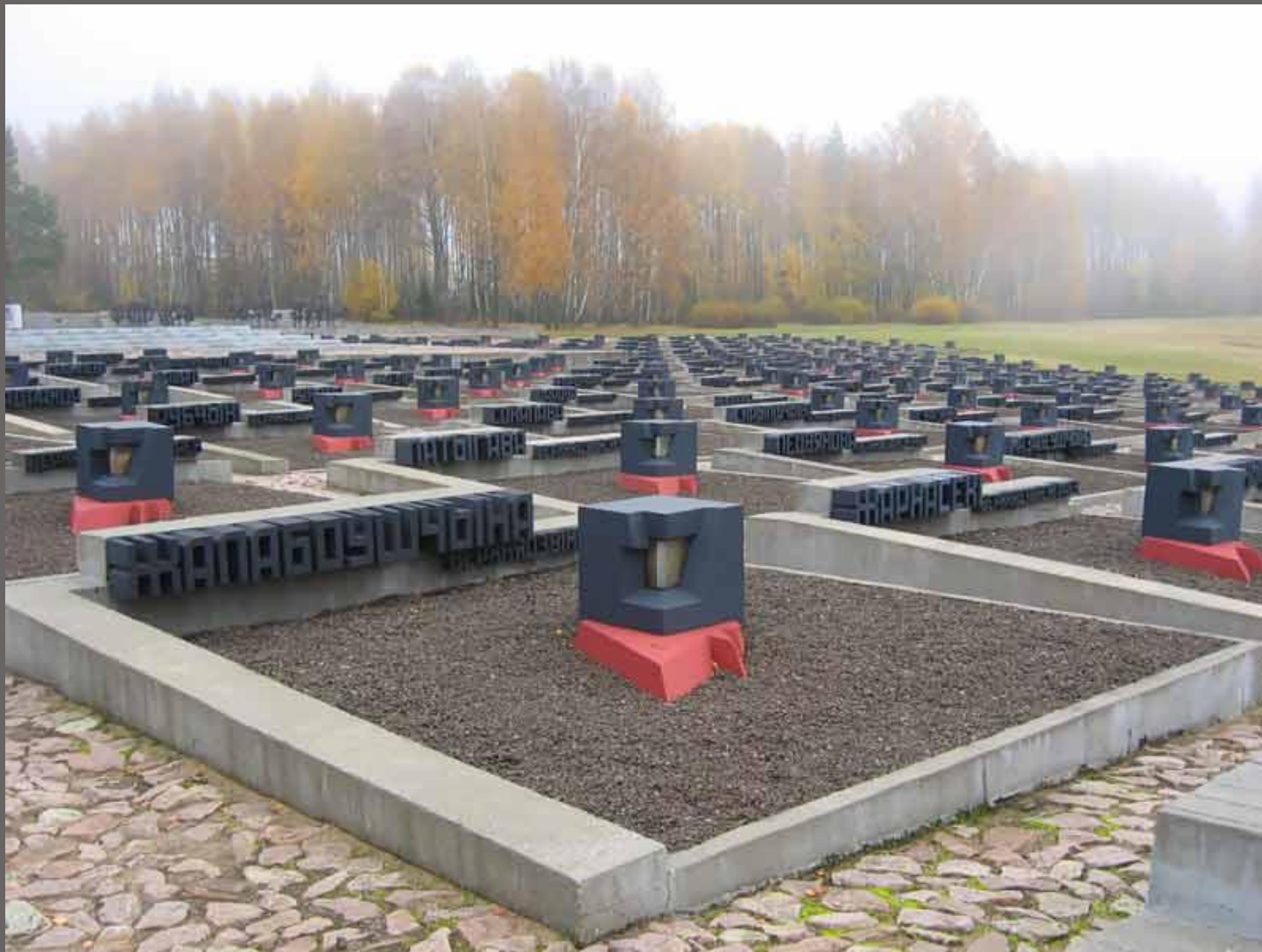
Единственное в мире Кладбище деревень.