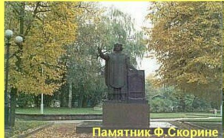
Памятник Ф. Скорине

Первое свое высшее образование Скорина, сын полоцкого купца, получил в Кракове. Там он прослушал курс «свободных наук» и был удостоен ученой степени бакалавра. Скорина получил также степень магистра искусств, которая давала тогда право поступать на самые престижные факультеты (медицинский и теологический) университетов Европы