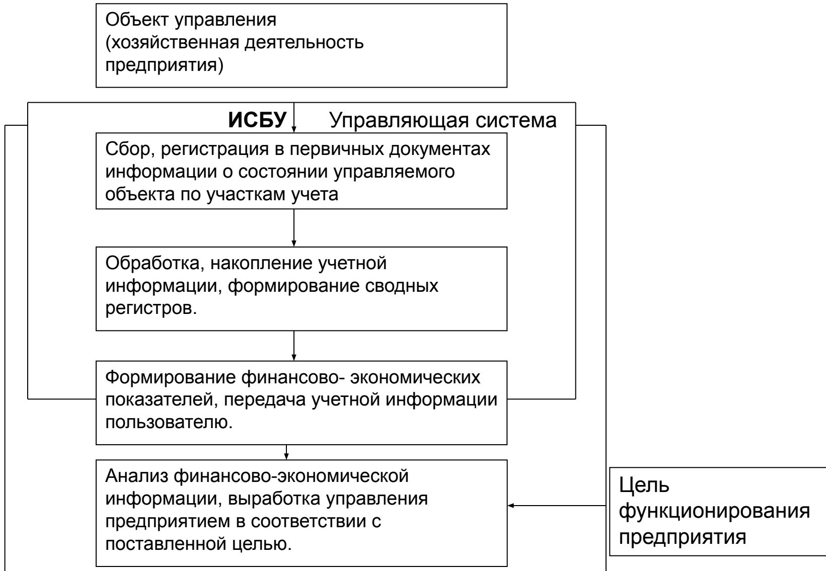
Схема управления предприятием с использованием ИСБУ.