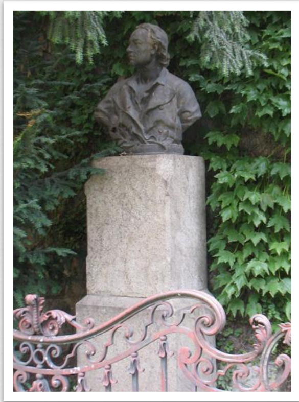
Погруддя скульптора Доннера (Братислава)