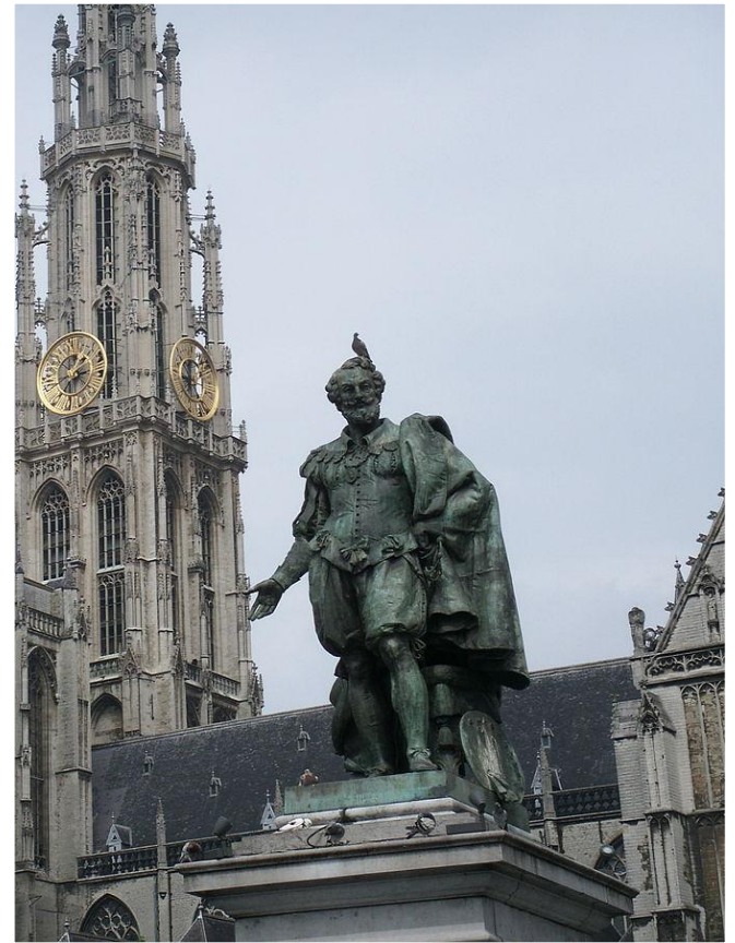
Пам'ятник Рубенсу в Антверпені