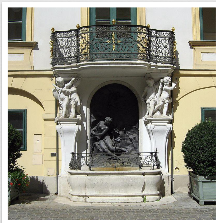
Фонтан Андромеда, прикута до скелі