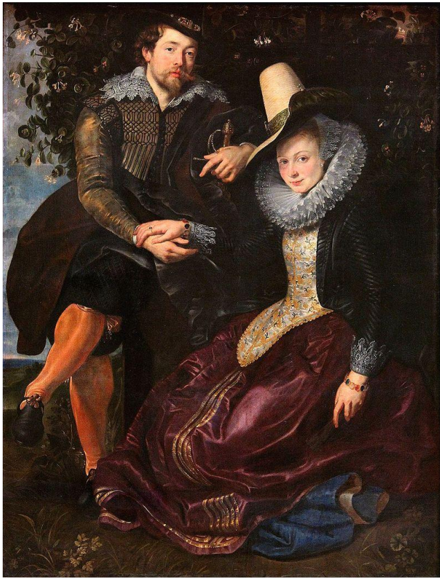
«Автопортрет з Ізабеллою Брант»