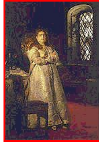
Софья до 1689