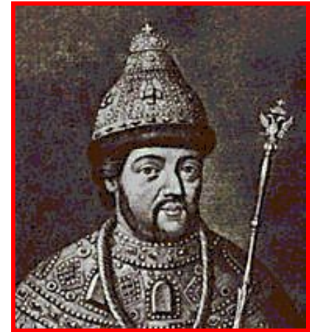
Иван с 1689 по 1696