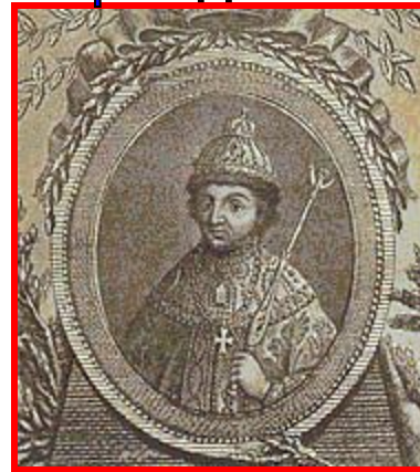
Федор до 1682