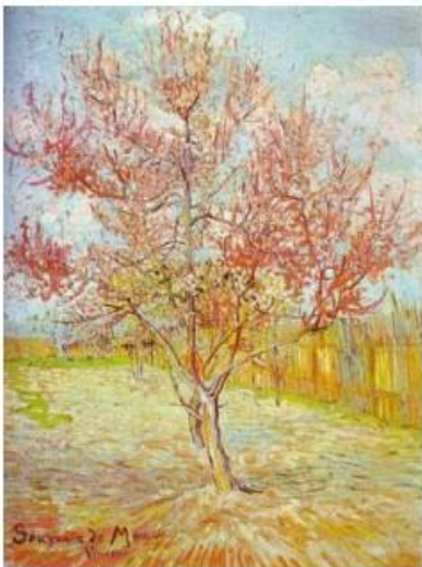
В. Ван Гог. Цветущее дерево