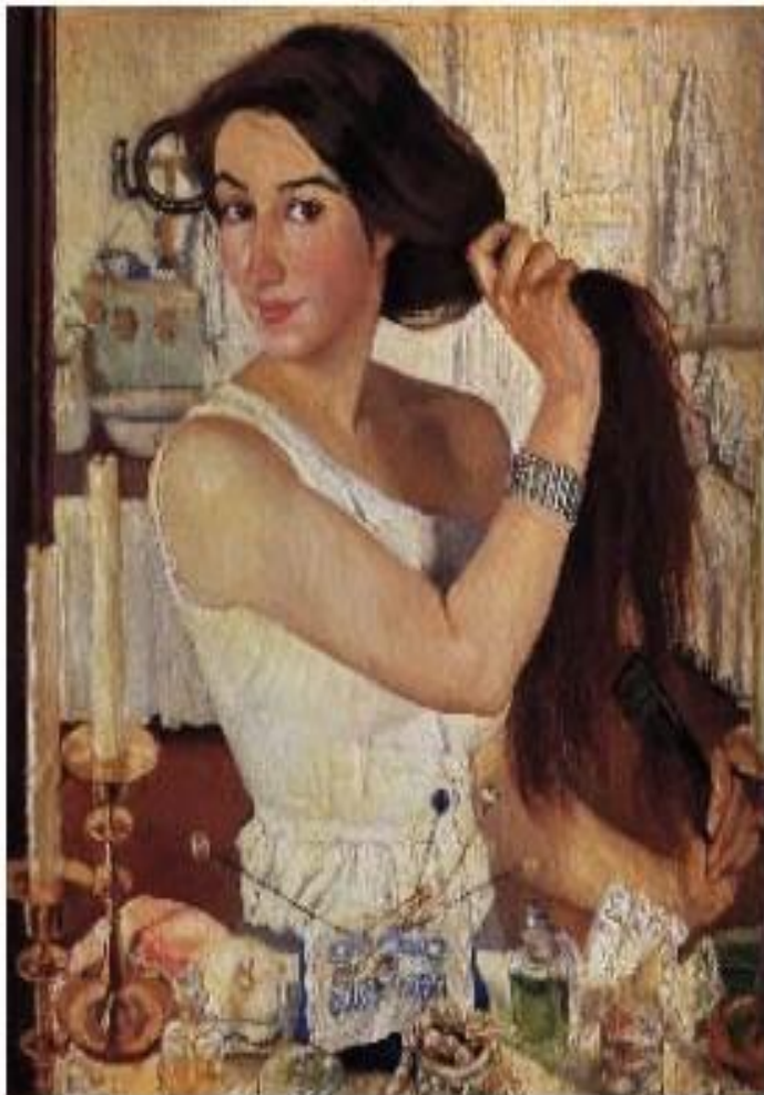
З. Серебрякова. Автопортрет

Во все времена человек стремился запечатлеть свое отношение к жизни в разных видах искусства. Все жизненные впечатления преломляются через внутренний мир художника и обращены к опыту каждого зрителя, читателя, слушателя. Чувства, воплощенные в искусстве, не тождественны жизненным. Они всегда опосредованы художественным идеалом, системой ценностных представлений. Художественные эмоции не слепок сиюминутных переживаний, а результат обдумывания, жизненного опыта.