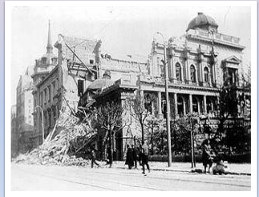
Белград после бомбардировок