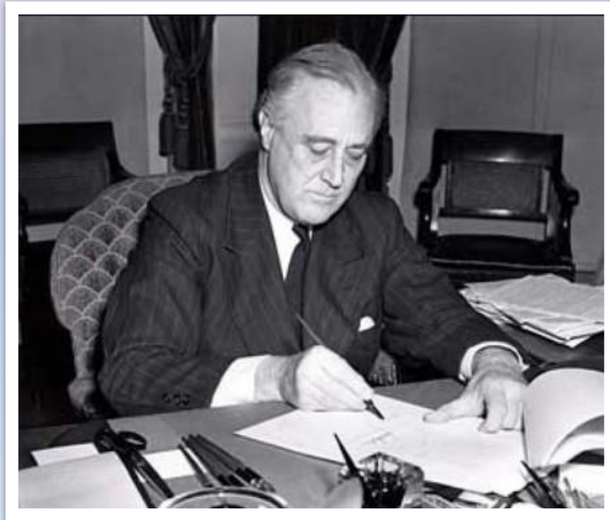
Президент США Франклин Д. Рузвельт подписывает закон о Ленд-лизе