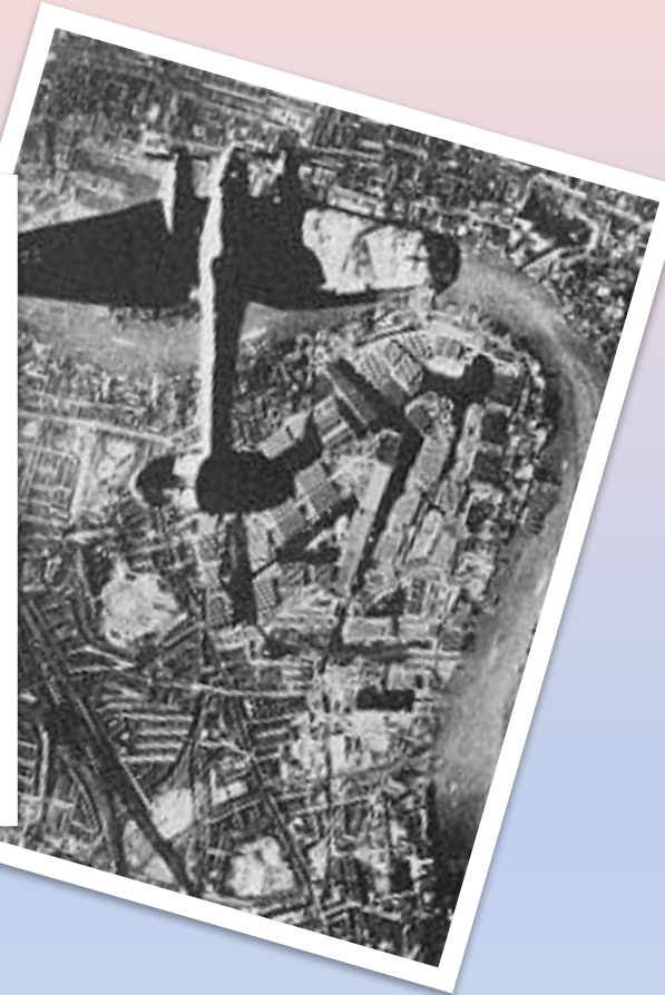
Лондон, 1940 г.