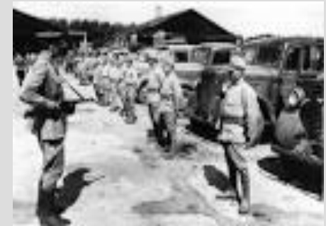
Японские военнопленные. 1945г.