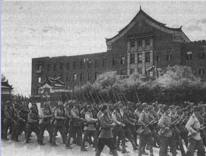
Советские войска в Китае. 1945г.

Утром 9 августа 1945 года советские войска начали боевые действия. Учитывая опыт войны с немцами, укрепленные районы японцев обходили мобильными частями и блокировали пехотой. Из Монголии в центр Маньчжурии наступала 6-я гвардейская танковая армия генерала Кравченко. 11 августа техника армии встала из-за отсутствия топлива, но был использован опыт немецких танковых частей - доставка топлива танкам транспортными самолетами. В результате до 17 августа 6-я гвардейская танковая армия продвинулась на несколько сотен километров - и до столицы Маньчжурии города Чаньчунь осталось около ста пятидесяти километров. Первый Дальневосточный фронт в это время сломил оборону японцев на востоке Маньчжурии, заняв крупнейший город в этом регионе - Муданьцзянь. В ряде районов советским войскам пришлось преодолевать упорное сопротивление противника. В полосе 5-й армии с особой ожесточенностью держалась оборона японцев в районе Муданьцзяна. Были случаи упорного сопротивления японских войск в линиях Забайкальского и 2-го Дальневосточного фронтов. Японская армия также предпринимала и многочисленные контратаки. 17 августа 1945 года в Мукдене советские войска взяли в плен императора Маньчжоу-Го Пу I (последний император Китая).