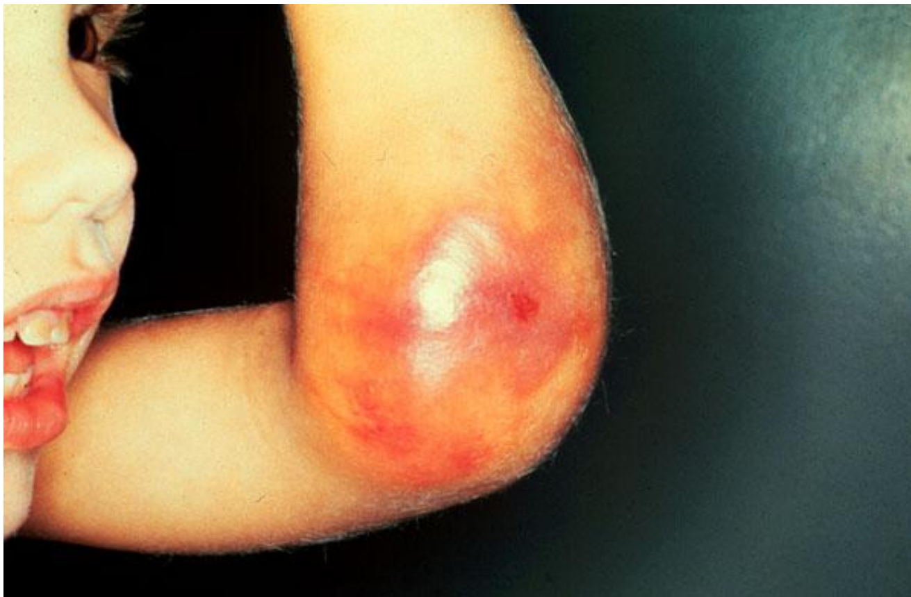
Гематома в локтевом суставе