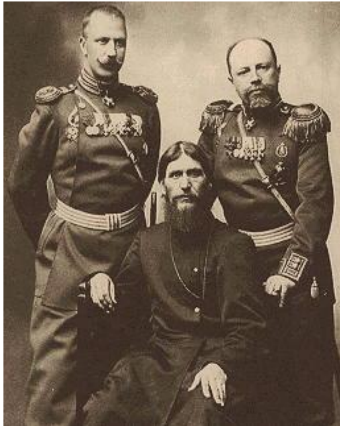
Распутин (Новых) Григорий Ефимович , последний фаворит императора Николая II и императрицы Александры Федоровны, из крестьян Тобольской губернии. (1864/65-1916)