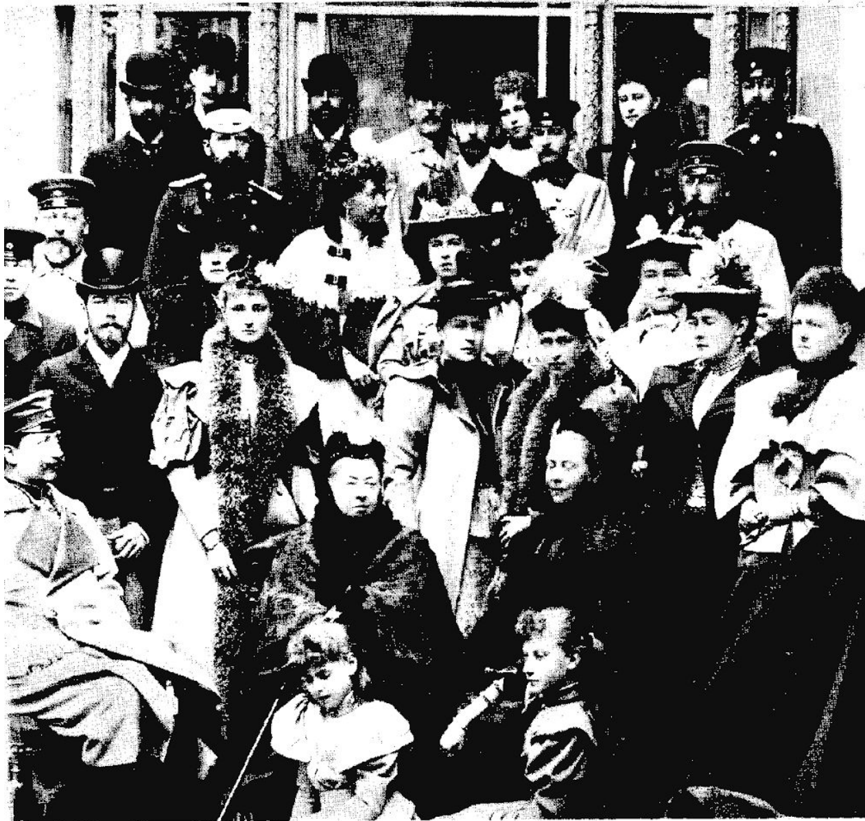
Английская королева Виктория в окружении семьи