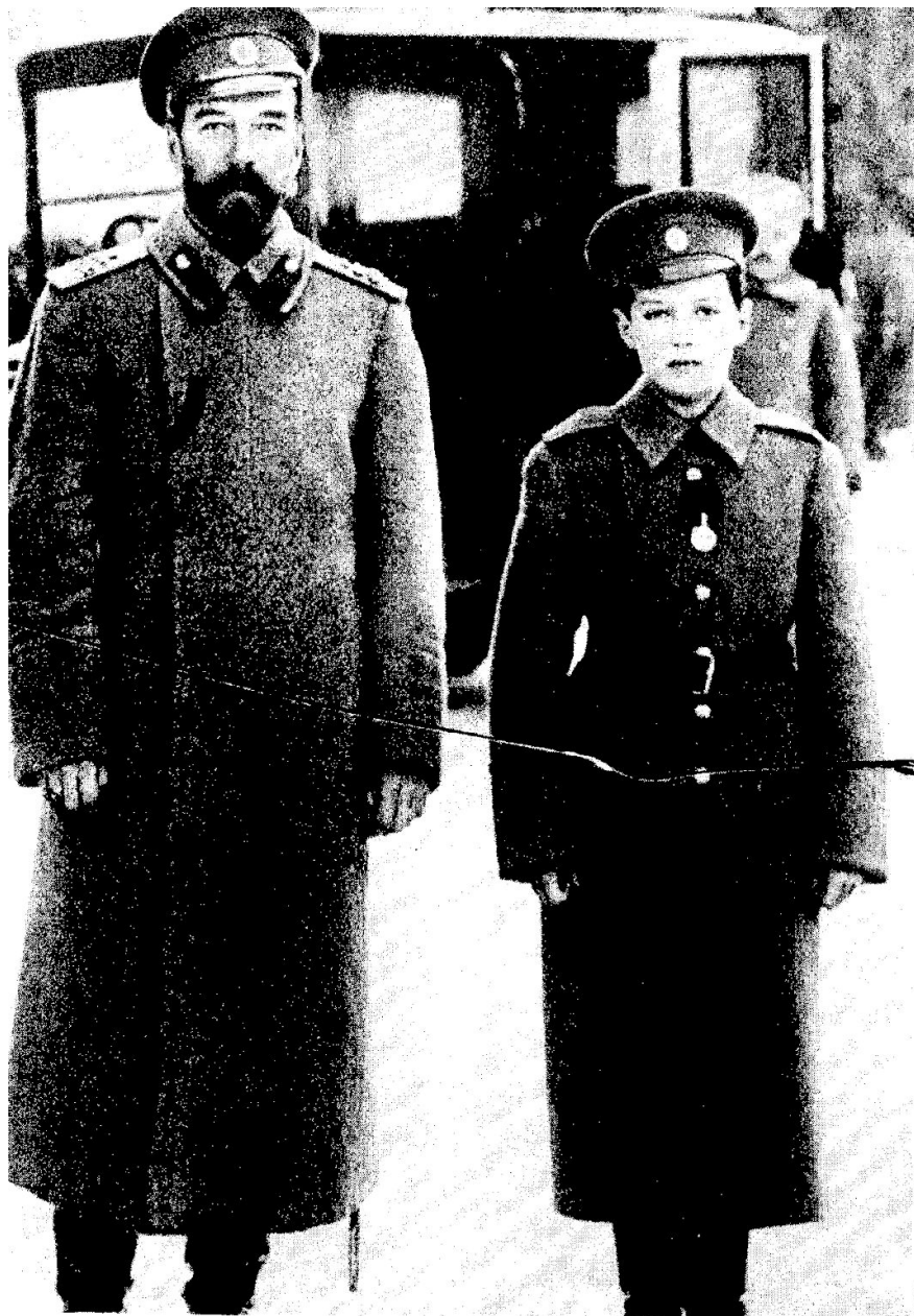
Отец и сын в ставке в Могилёве