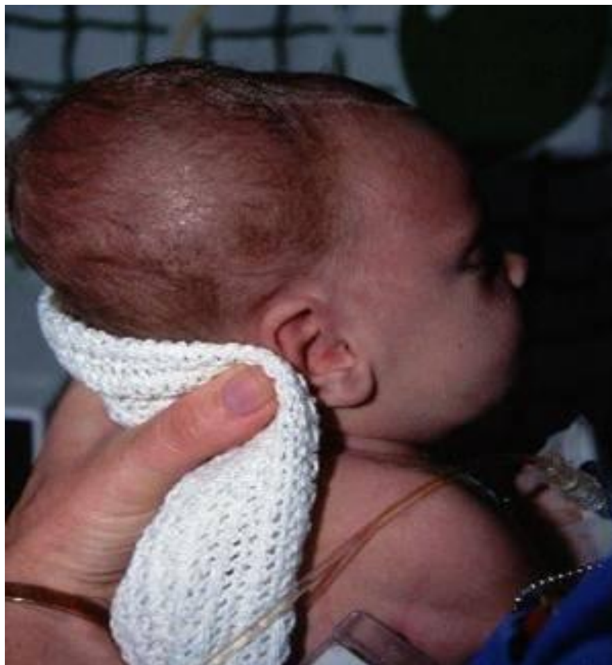
Гематома на голове у новорождённого