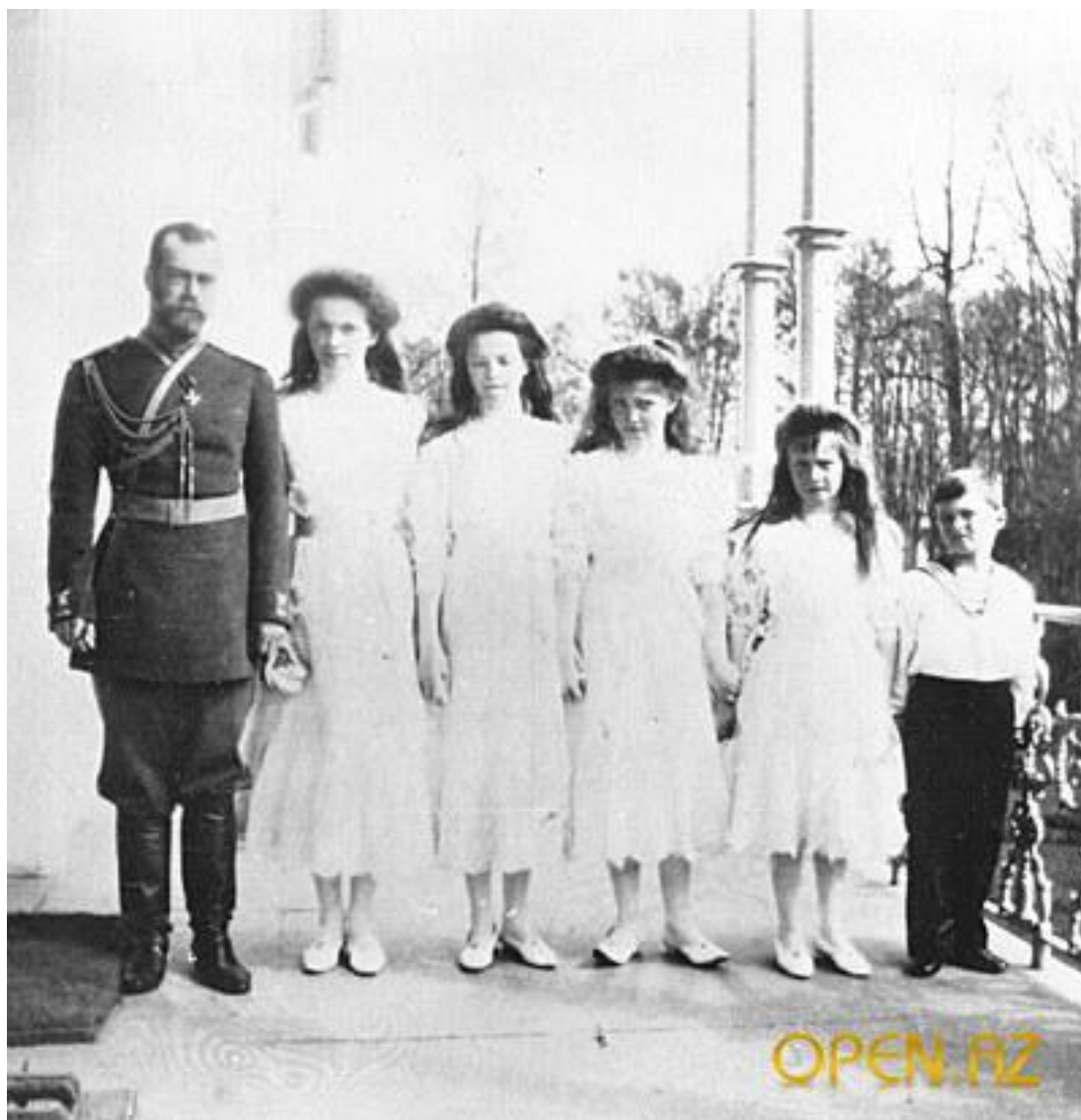
Император с детьми