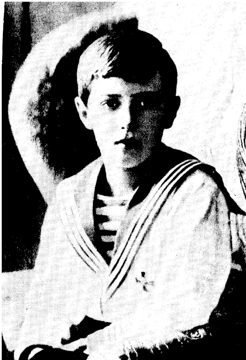
Цесаревич – наследник престола