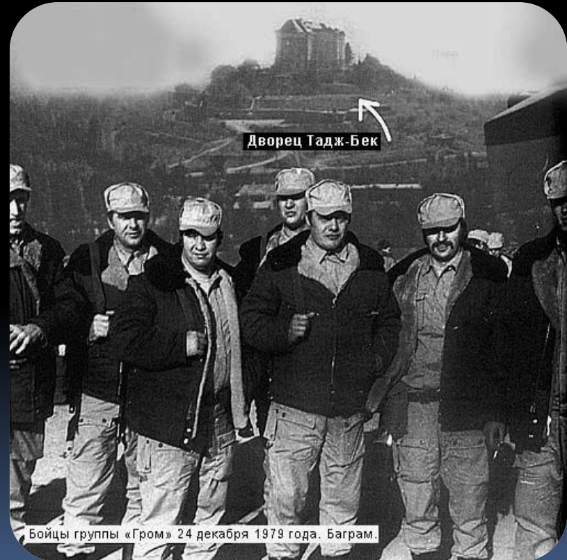
Бойцы группы «Гром» 24 декабря 1979 года. Баграм.