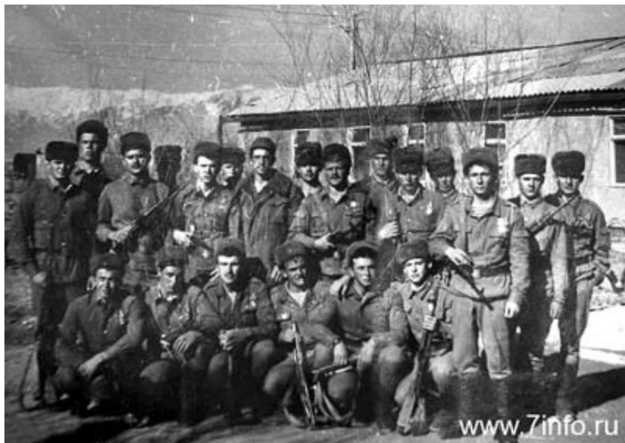
9-я Рота. Афганистан 1989

15 февраля — из Афганистана полностью выведены советские войска. Выводом войск 40-й армии руководил последний командующий Ограниченным контингентом генерал-лейтенант Б. В. Громов, который, как утверждается, последним перешёл пограничную реку Аму-Дарья (город Термез).