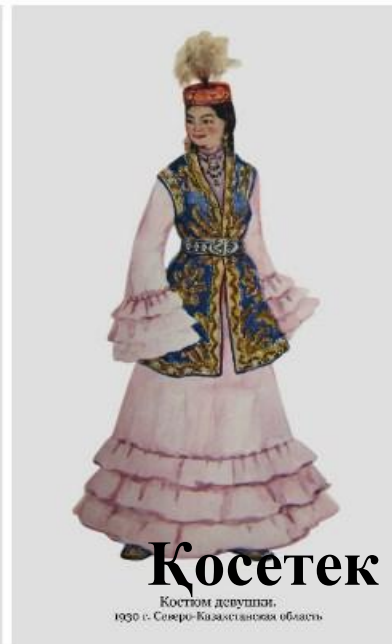
Костюм девушки, 1930 г. Северо-Казхастанская область