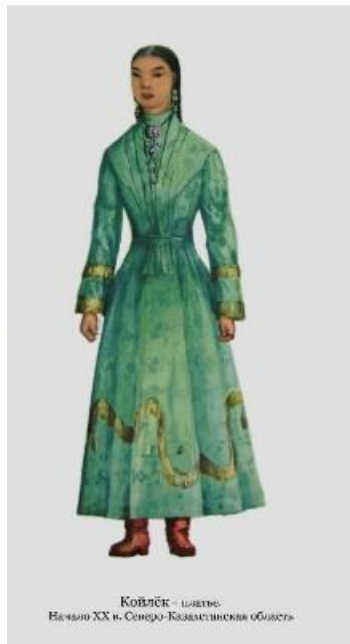
Койлек - шашы. Начало XX в. Северо-Казхастанская область