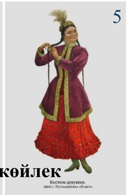
Костюм девушки, 1920 г. Кустанайская область