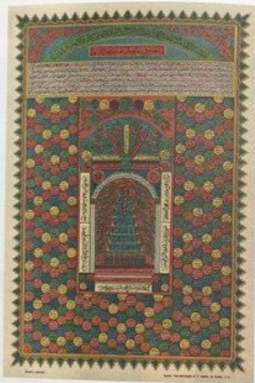
British Library MS. Or. 100 Fol. 100v The Great Mosque at Moscow