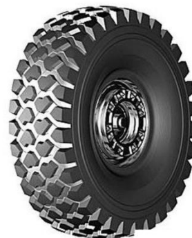
ШИНА БЕЛШИНА БЕЛ-95 16.00 R 20