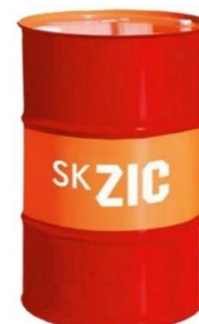
МАСЛО МОТОРНОЕ ZIC X5 10W-40 200 ЛИТРОВ