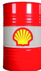
МОТОРНОЕ МАСЛО SHELL RIMULA R5 E 10W40 209 Л.