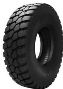
АВТОШИНА 16.00R20 GL073A SAMSON 18PR900

Грузовые шины от ООО «СРТ» — высококачественные автошины для грузовых автомобилей, из широкой линейки шин для всех типов дорожного покрытия и различными вариантами рисунка протектора: универсальным, повышенной проходимости, дорожным, карьерным и внесезонным. Уже более 30 лет грузовые автошины КАМА пользуются доверием водителей благодаря надежности, безопасности и доступным ценам.