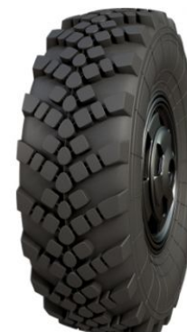
ШИНА NORTEC TR 1260 425/85 R21