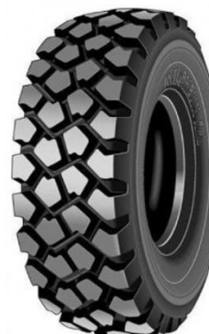
ГРУЗОВАЯ ШИНА 16.00 R 20 MICHELIN XZL Б.У. ИЗНОС 5-7%