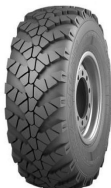
ГРУЗОВАЯ ШИНА TYREX CRG POWER O-184, 425/85R21 HC20

Состояние: Новое Страна производитель: Россия