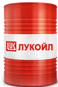
ВМГЗ ЛУКОЙЛ 216,5Л. (175КГ) МАСЛО ГИДРАВЛИЧЕСКО Е

Выбор моторного масла – это ответственный процесс, особенно когда дело касается грузовых автомобилей. Специфика работы такого транспорта заключается в постоянных повышенных нагрузках, когда двигатель должен работать на пределе своих возможностей. Именно поэтому необходимо использовать специально отобранные ООО «СРТ» моторные масла, справляющиеся со сложными условиями эксплуатации механизмов авто.