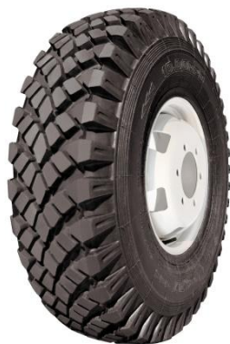
ГРУЗОВАЯ ШИНА КАМА 1260-2 425/85R21

Грузовые шины от ООО «СРТ» — безусловное качество на ХМАО среди компаний поставщиков первой линейки. ООО «СРТ» непрерывно прикладывает усилия и ведет поиск новых редких моделей шин, изучает технологии, а также активно сотрудничает с производителями напрямую. В итоге — грузовые шины от ООО «СРТ» имеют гарантию оригинального производителя, а значит имеют низкое сопротивление качению, высокие сцепные характеристики, показывают высокую «ходимость» и помогают транспортным предприятиям экономить на топливе.