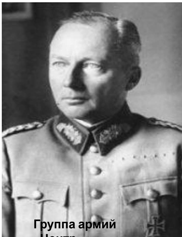
Группа армий «Центр»

Немецкая операция «Цитадель» контролировалась двумя талантливейшими генералами-фельдмаршалом фон Клюге и генералом Эрихом фон Манштейном.