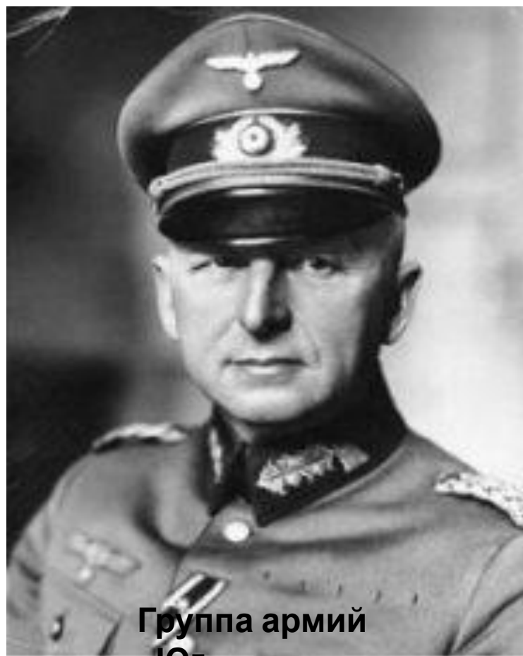
Группа армий «Юг»