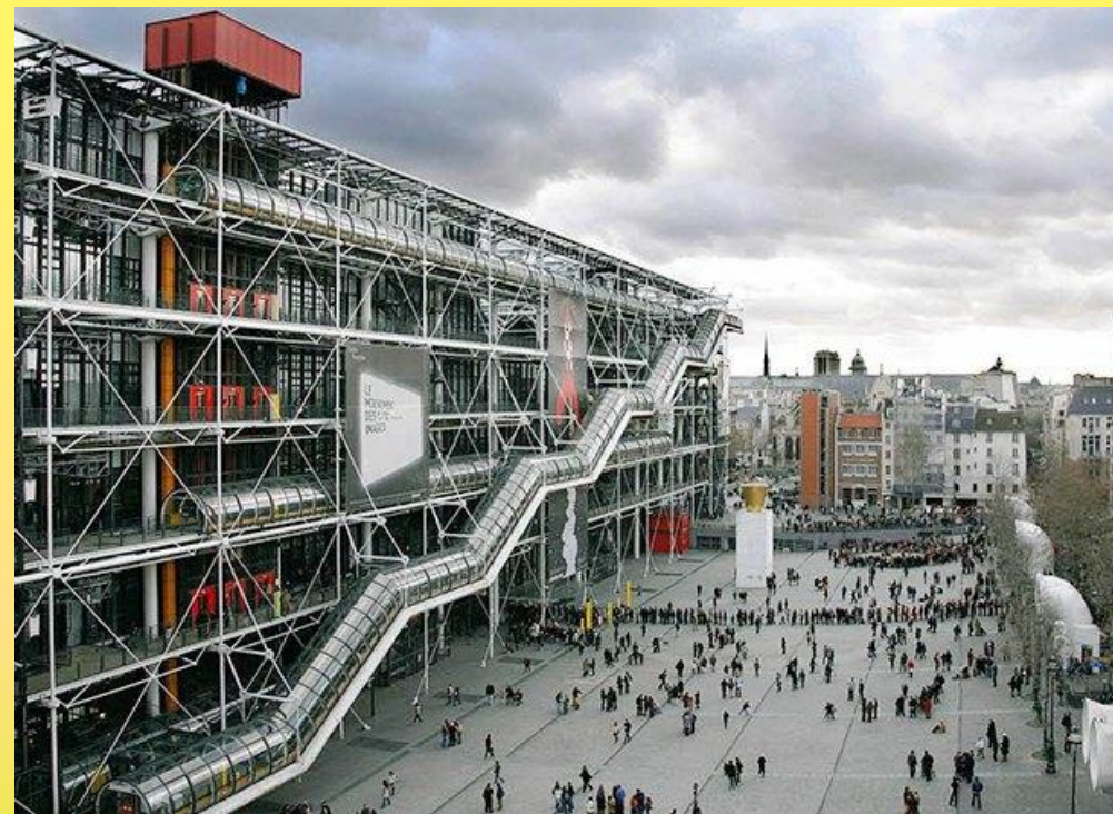
ГОД ПОСТРОЙКИ: 1971–1979, АРХИТЕКТОРЫ: Ричард Роджерс и Ренцо Пиано