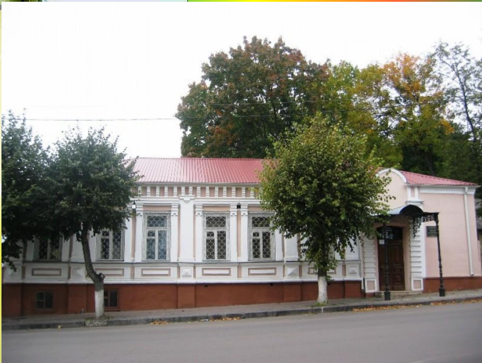
Музей И.А. Бунина в г.Орле