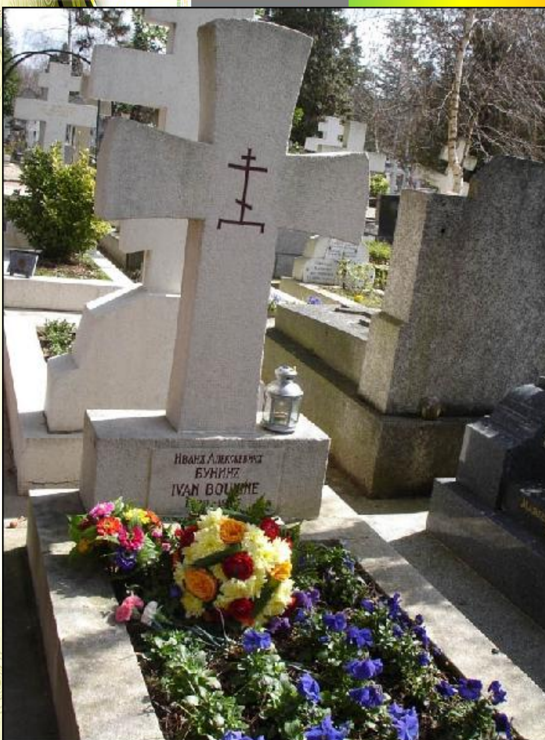
Могила И.А.Бунина на кладбище Сент-Женевьев-де- Буа. Париж