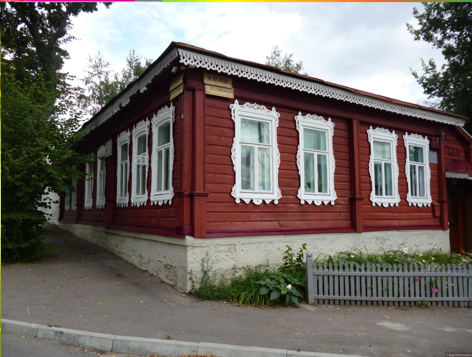
Дом-музей писателя в Ельце