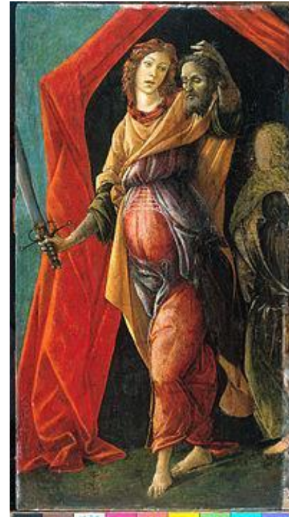
«Юдифь, покидающая палатку Олоферна»