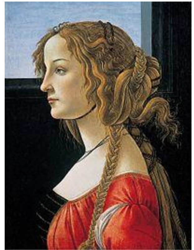
Портрет молодой женщины