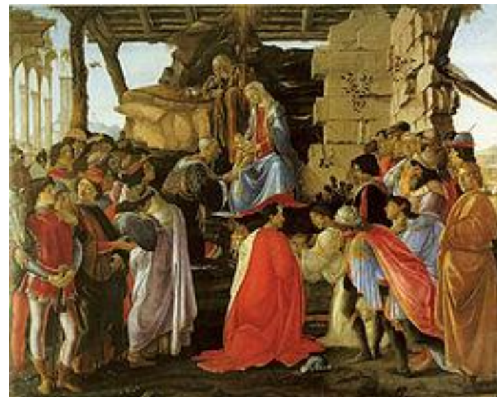
«Поклонение волхвов» (около 1475)