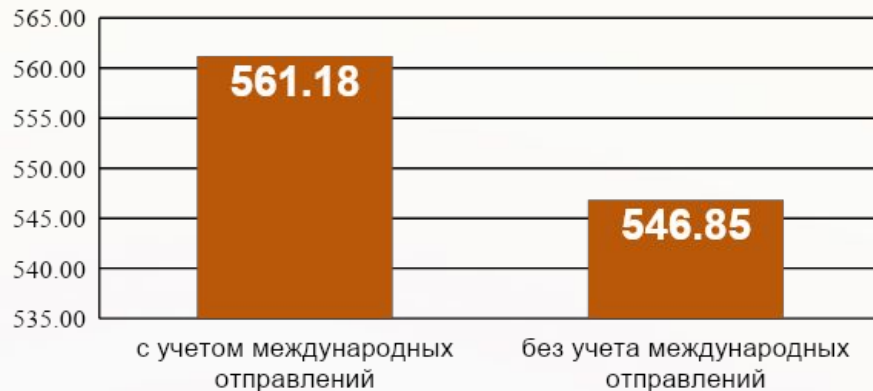
Объем письменной корреспонденции в 2010 году (млн шт.)