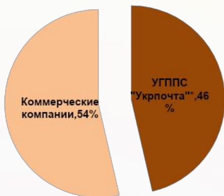
Письменная корреспонденция (млн шт.)