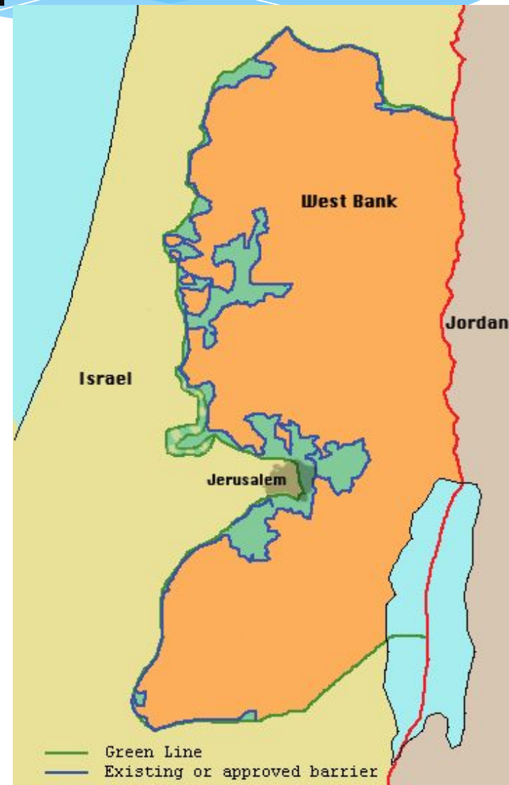
West Bank barrier - May 2005