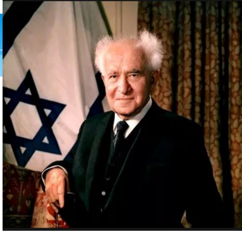
Давид Бен-Гурион (1886-1973)

* 15 мая 1948 Лига арабских государств объявила Израилю войну и пять арабских государств (Египет, Сирия, Иордан, Ирак, Алжир) напали на Израиль.