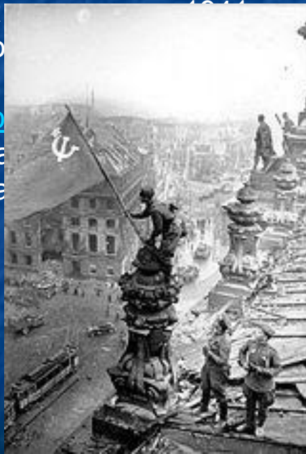
Знамя Победы над рейхстагом

Договор о ненападении между Германией и Советским Союзом. Советским войскам удалось остановить её вторжение к концу осени 1941г. и перейти с декабря 1941г. в контрнаступление. В период с 1944г. по май 1945г. советские войска освободили всю территорию СССР, а также подписанием Акта о безоговорочной капитуляции Германии. Война привела к победе на Советского Союза, привела к большому ущербу всему населению и разрушению части промышленности.