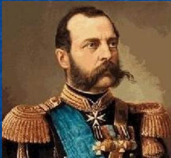
Царь Александр II