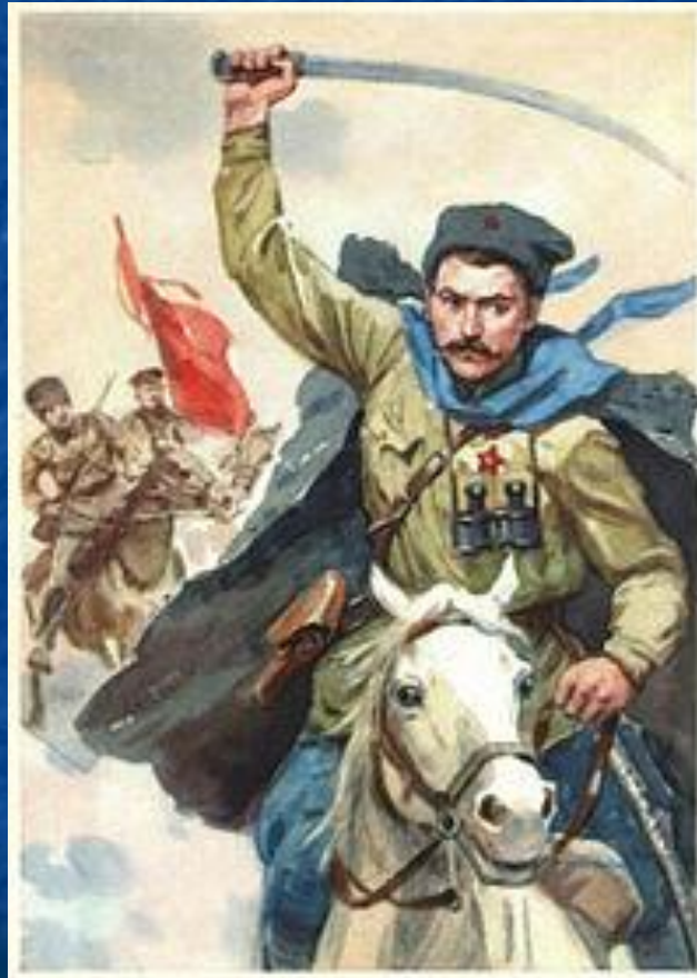
Герой Гражданской войны В. Чапаев

Основная борьба за власть в период Гражданской войны велась между большевиками с Красной армией («красными»), с одной стороны, и «белыми» (офицерством, казачеством, интеллигенцией, помещиками, буржуазией), с другой.