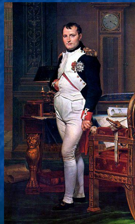
Император Наполеон I