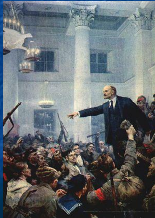
Глава Советского государства

В конце 1917 года произошло свержение Временного правительства, захват власти партией большевиков и установление советской власти — произошла Октябрьская революция .