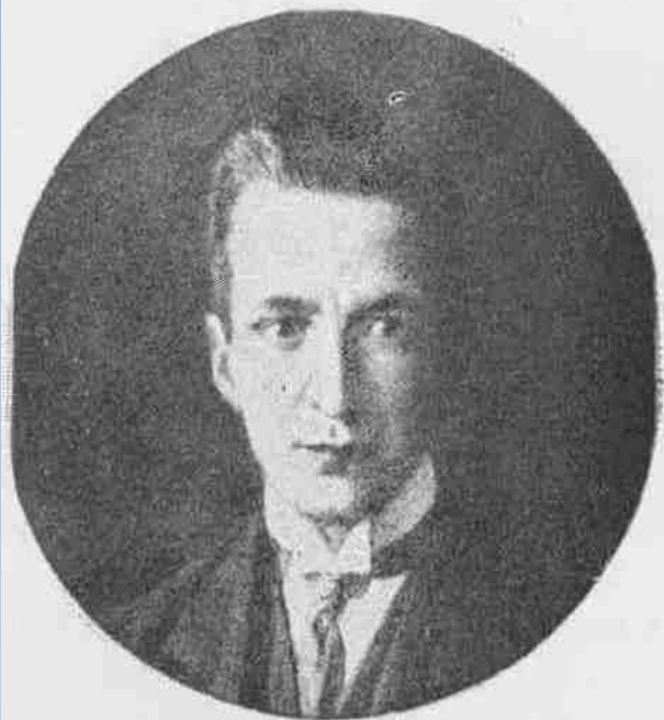
Лидер трудовиков, член партии социалистов-революционеров, Керенский