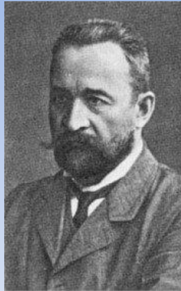
Львов Георгий Евгеньевич - князь, русский политик