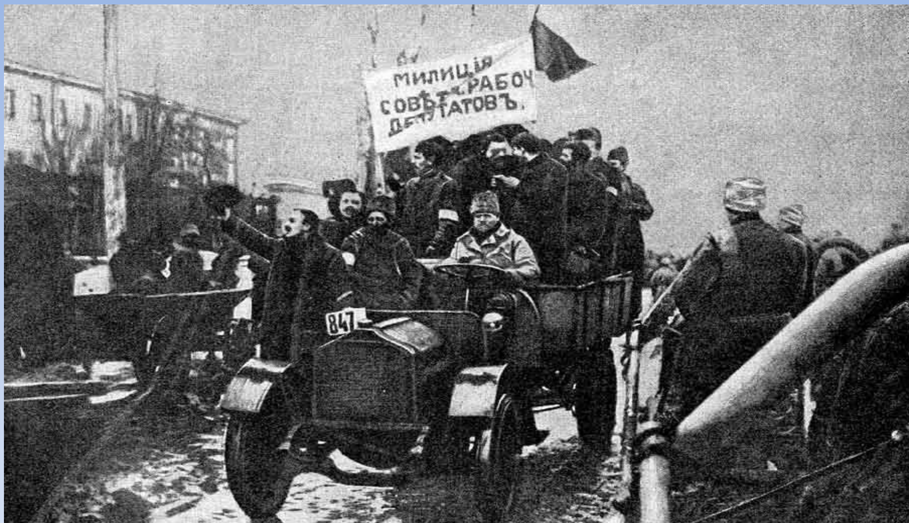
Петроград. Февраль 1917 года