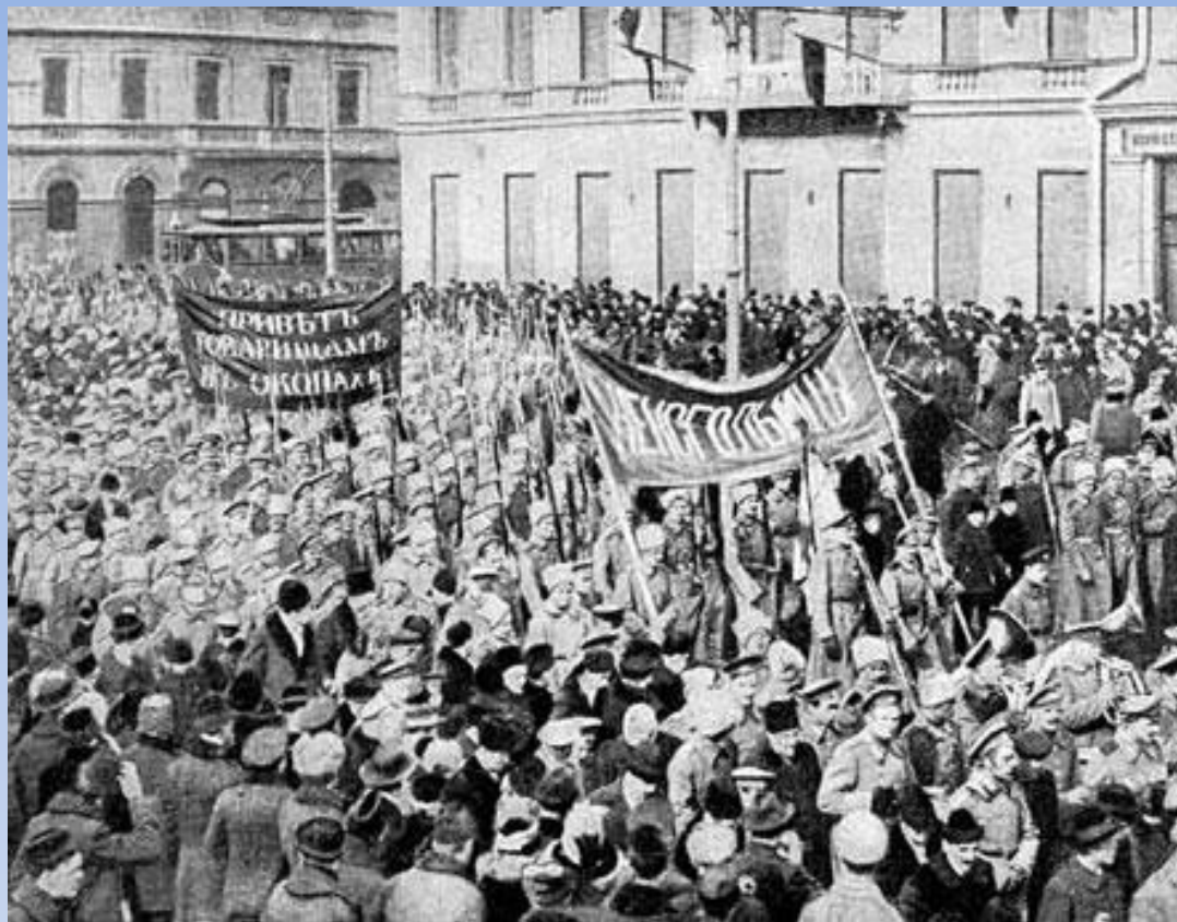
Солдатская демонстрация в Петрограде февраль 1917 года