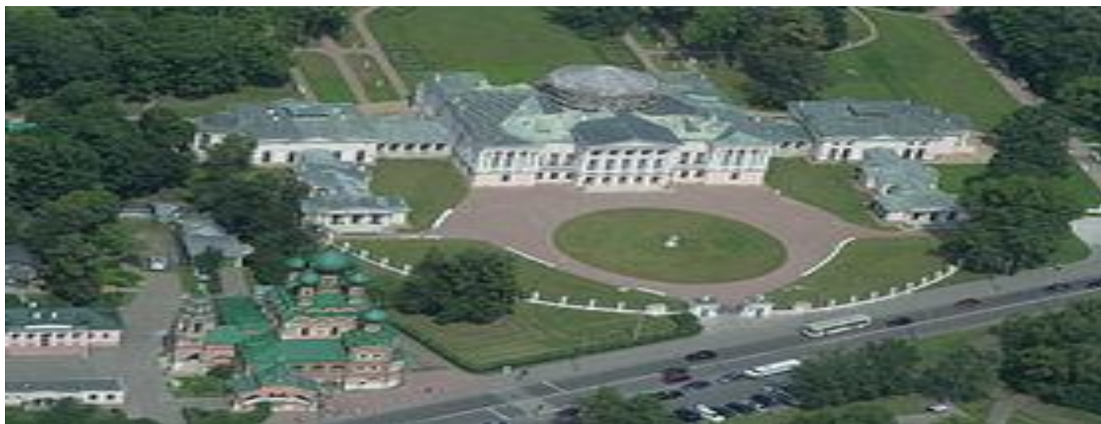
Архитектурный ансамбль и парк в Останкино