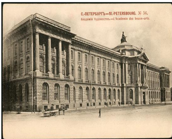
Академия художеств в Петербурге 1757 г.