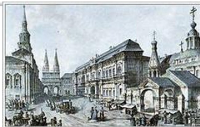
Московский университет 1755 г.