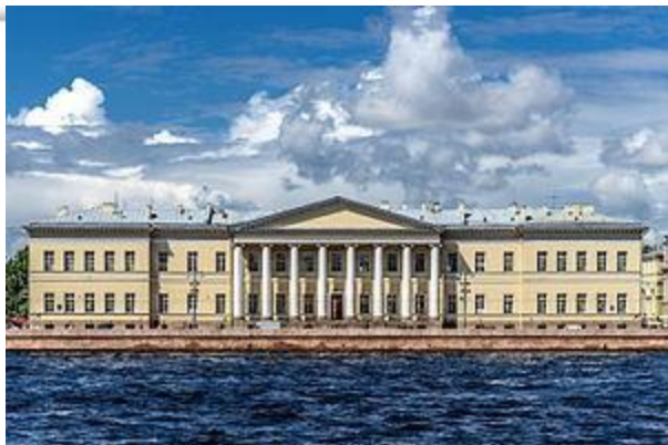
Петербургская академия наук 1721 г.