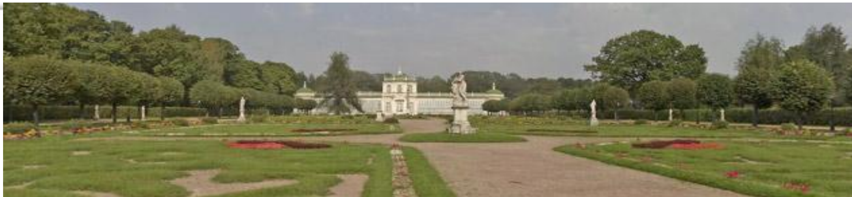
Архитектурный ансамбль и парк в Кусково