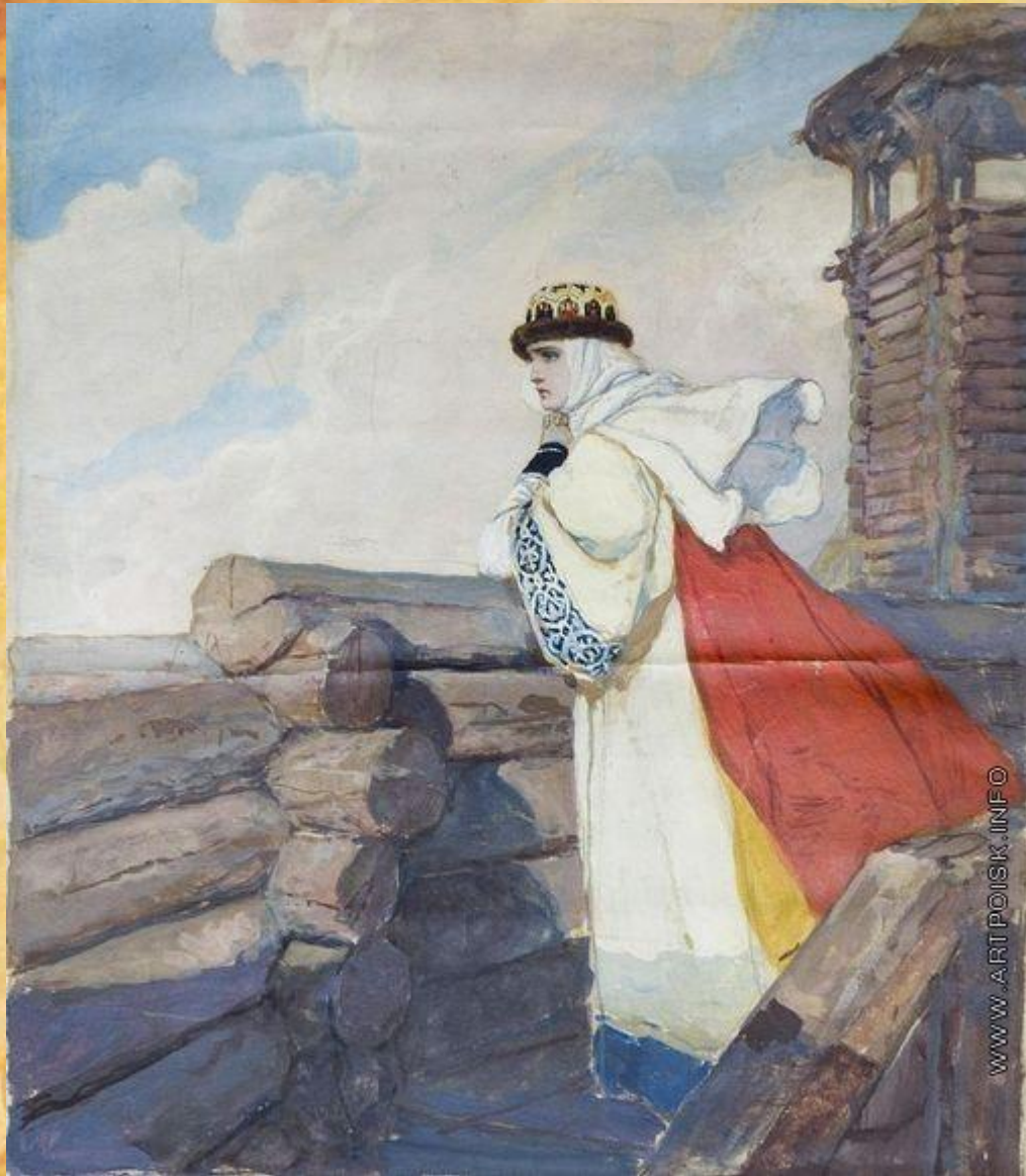
Картина В. Серова

С образом Ярославны связан самый трогательный момент в "Слове о полку Игореве" - плач Ярославны. В этом эпизоде выражается вся тоска и печаль Ярославны, ожидающей мужа с войны: