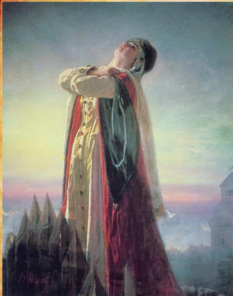
Картина В. Перова 1881 год

Ярославна стала идеалом для русских женщин на многие века.