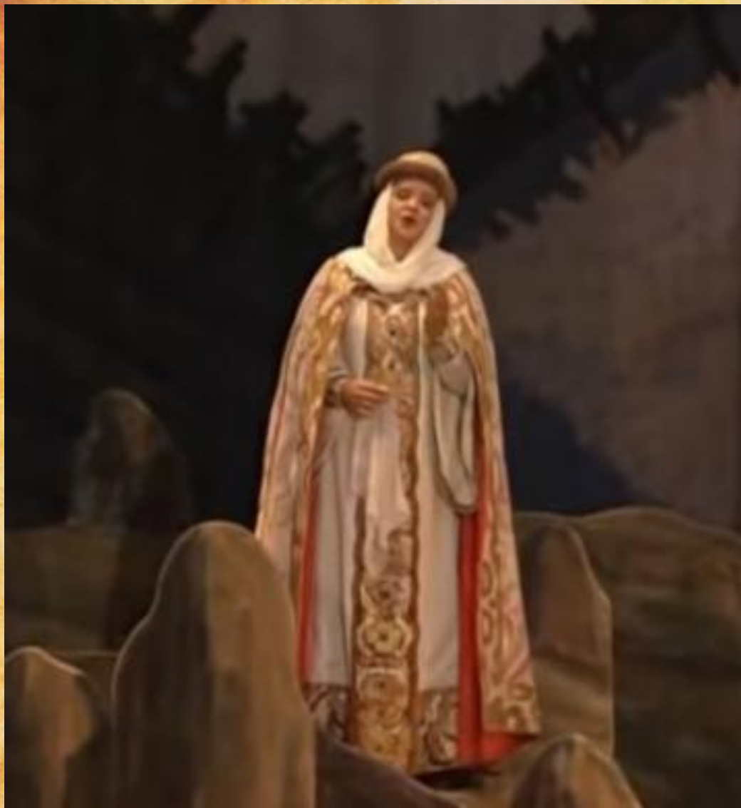
Сцена «Плача Ярославны» В опере «Князь Игорь»

Выдающееся творение гениального русского композитора Александра Порфирьевича Бородина - опера «Князь Игорь».