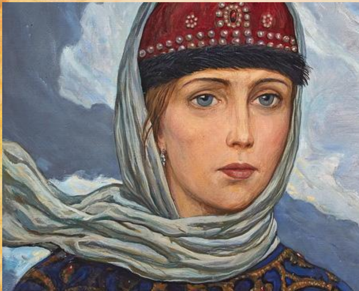
Картина И. Глазунова

Образ Ярославны покориł художников, портрет стал одним из используемых в изобразительном искусстве. Мастерам кисти хотелось передать детали скрытых в тексте признаков женской привлекательности. Художники пытались передать красками душу и любовь.