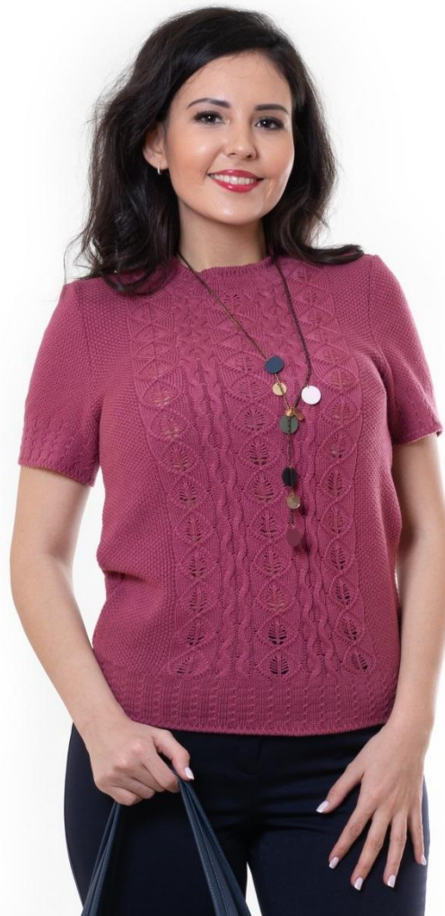
Цвет брусника Размер 44-56