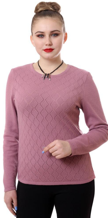
Цвет сухая роза Разм. 46-56