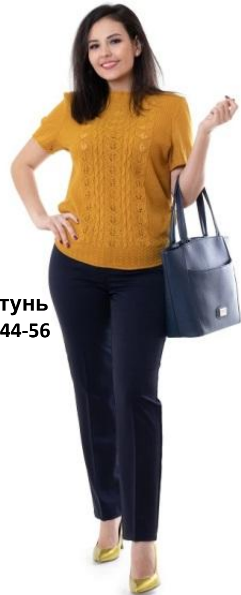
Цвет латунь Размер 44-56