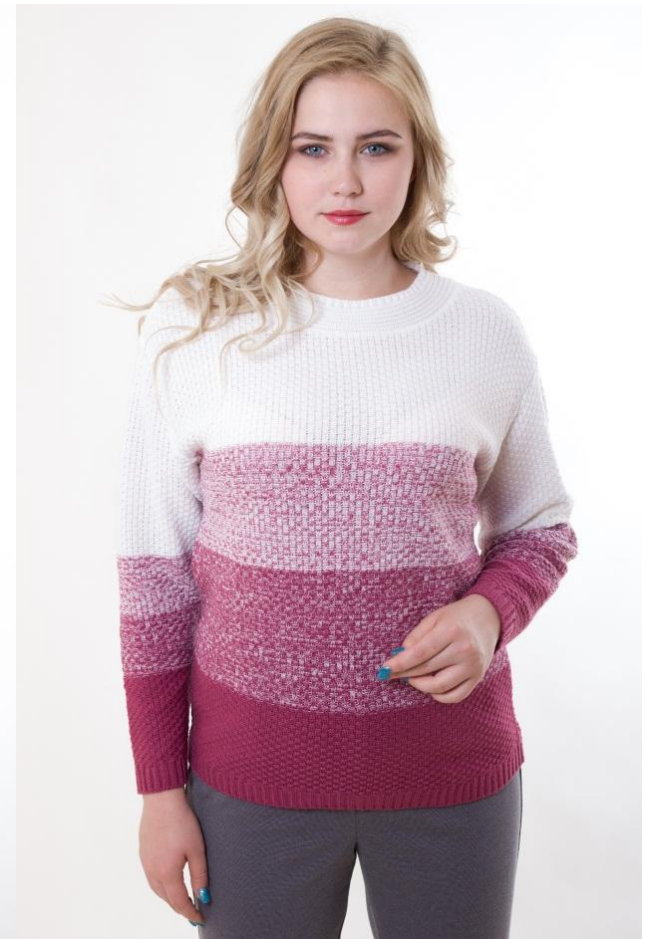
Цвет белый + брусника Разм. 46-56