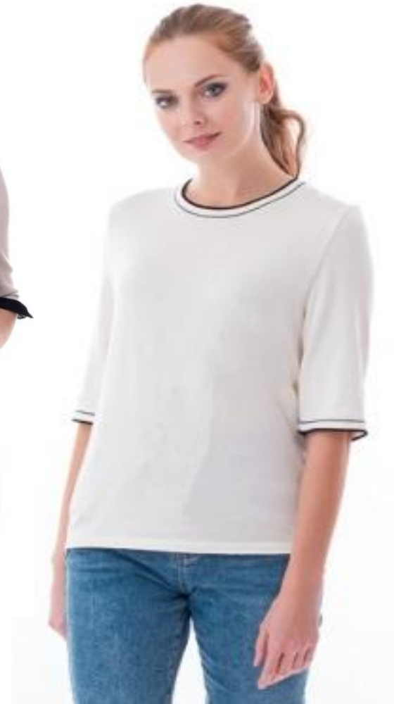
Цвет молочный Размер 44-54