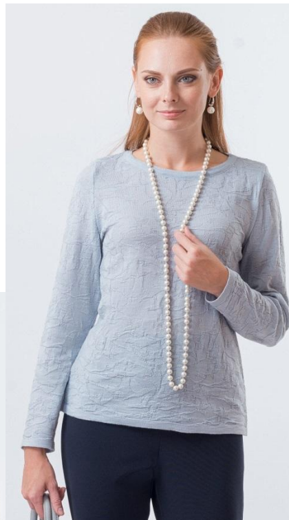
Цвет серебро Размер 46-56