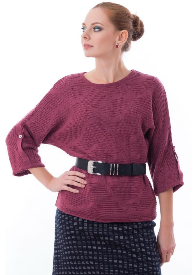
Цвет брусника Размер 46-56