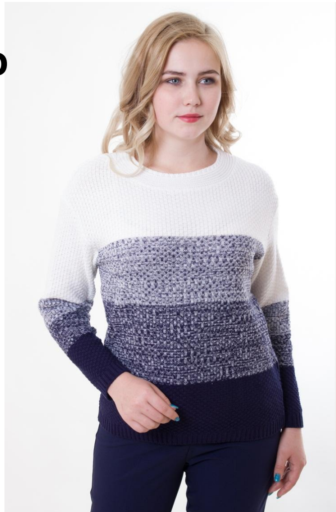
Цвет белый + синий Разм. 46-56