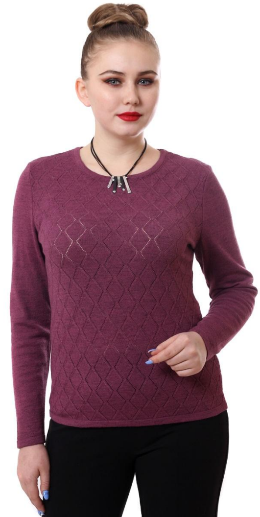
Цвет сирень Разм. 50 - 56

скидка оптовика не действует на данную модель