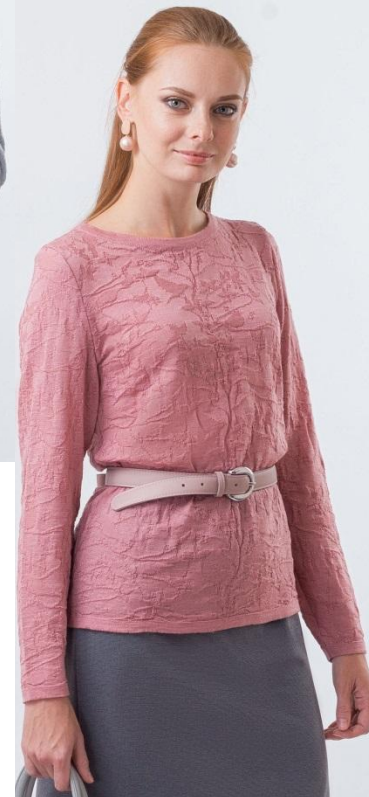
Цвет клевер Размер 46-56