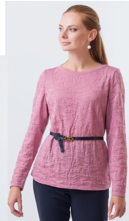
Цвет макияж Размер 46-56