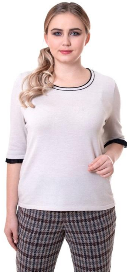
Цвет св. серый Размер 44-54