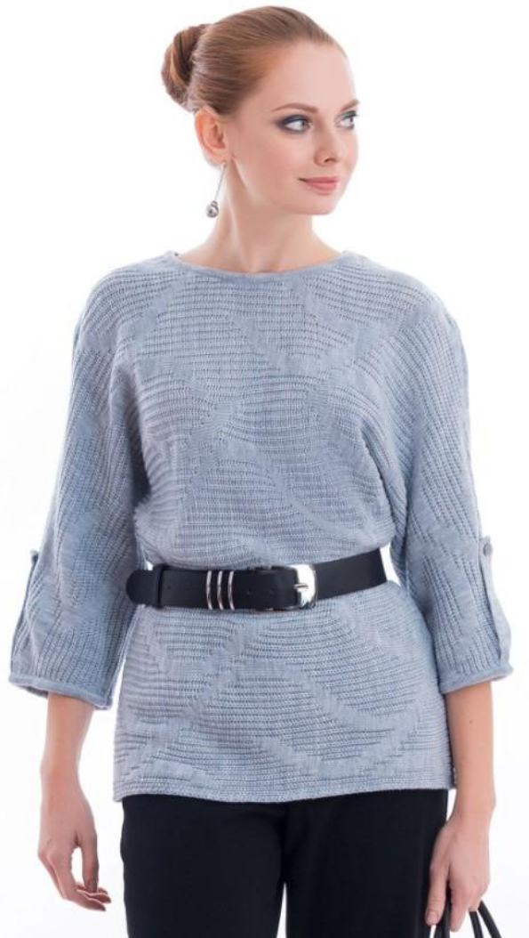
Цвет серо-голубой Размер 46-56