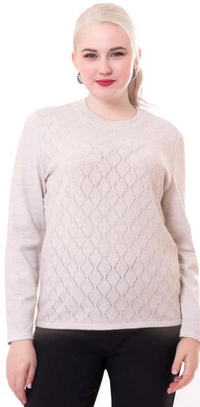
Цвет бежевый Разм. 46-56