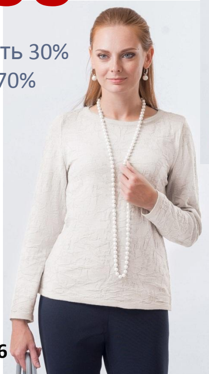
Цвет белый Размер 46-56