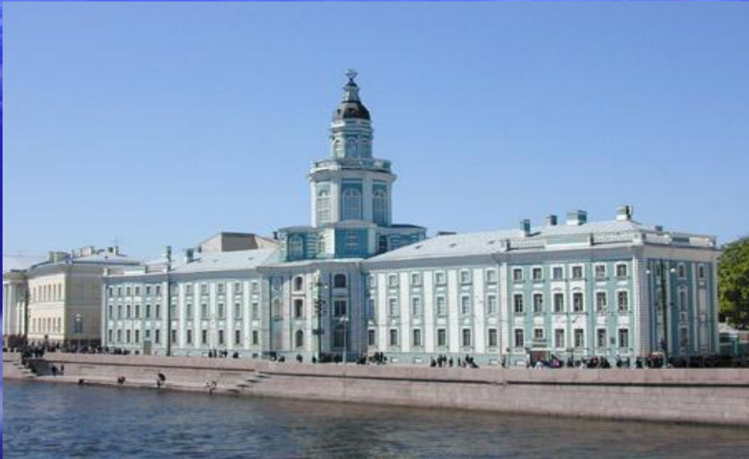
Кунсткамера, арх. Маттарнови, Киавери