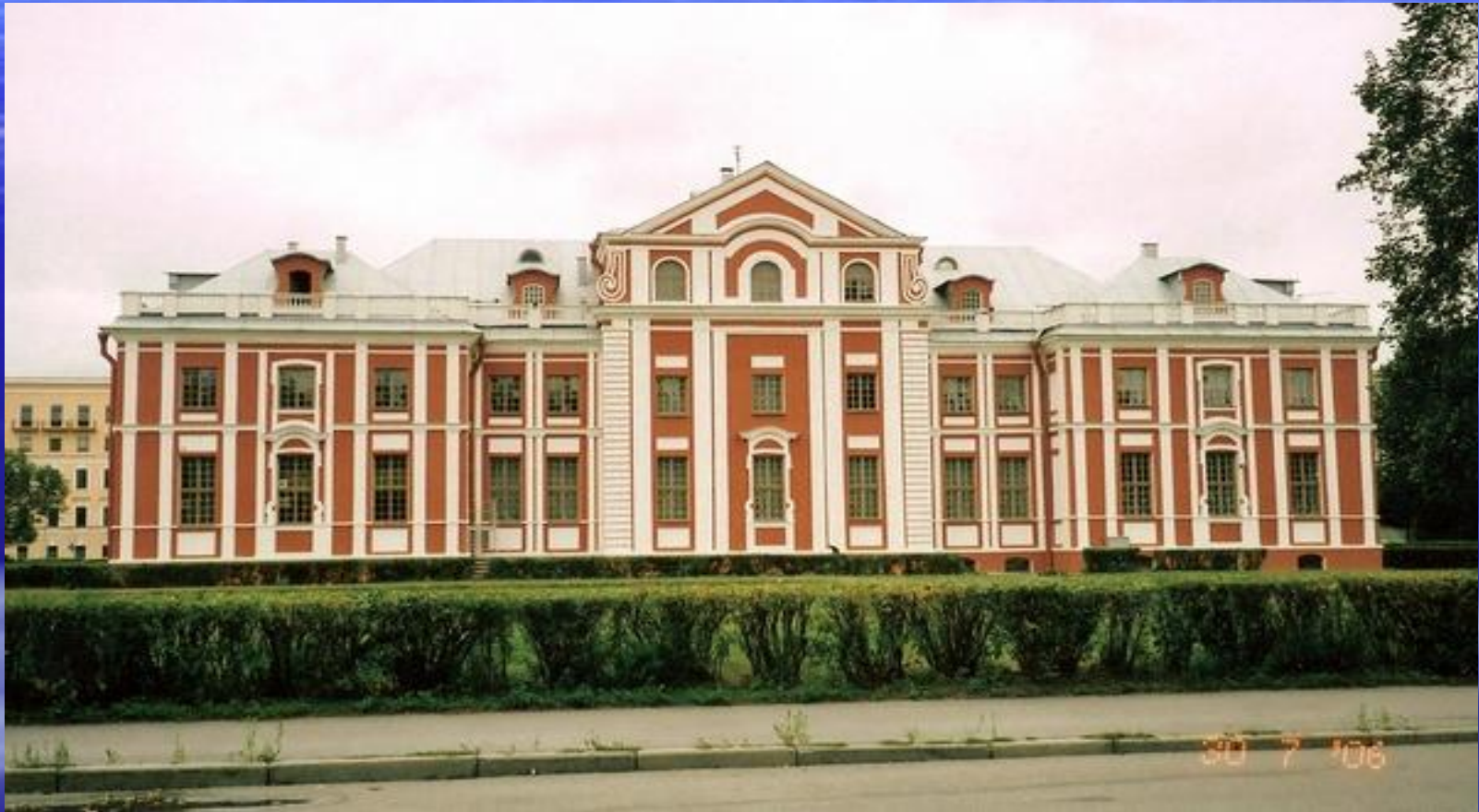
Кикины палаты, арх. неизвестен