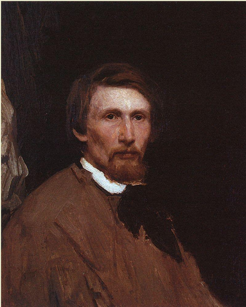
В.М. Васнецов. Автопортрет 1873

Великий русский живописец. Основоположник особого «русского стиля», преобразованного из исторического жанра и романтических тенденций, связанных с фольклором и символизмом. С 1880 года создавал картины на темы русской истории, сказок, былин. Он одним из первых обратился к русскому фольклору. Стремился в поэтической форме воплотить вековые народные идеалы и высокие патриотические чувства.