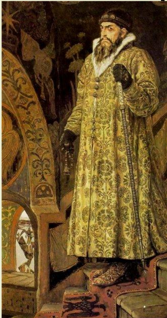
«Царь Иван Васильевич Грозный» 1897