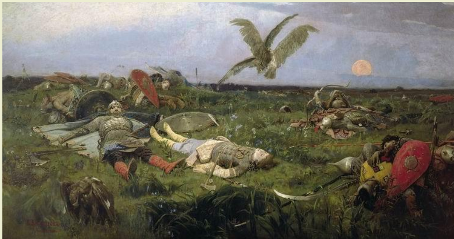
«После побоища Игоря Святославича с половцами» 1880