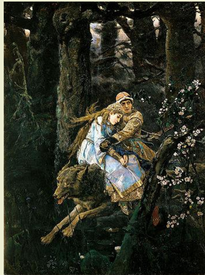
«Иван Царевич на Сером Волке» 1879