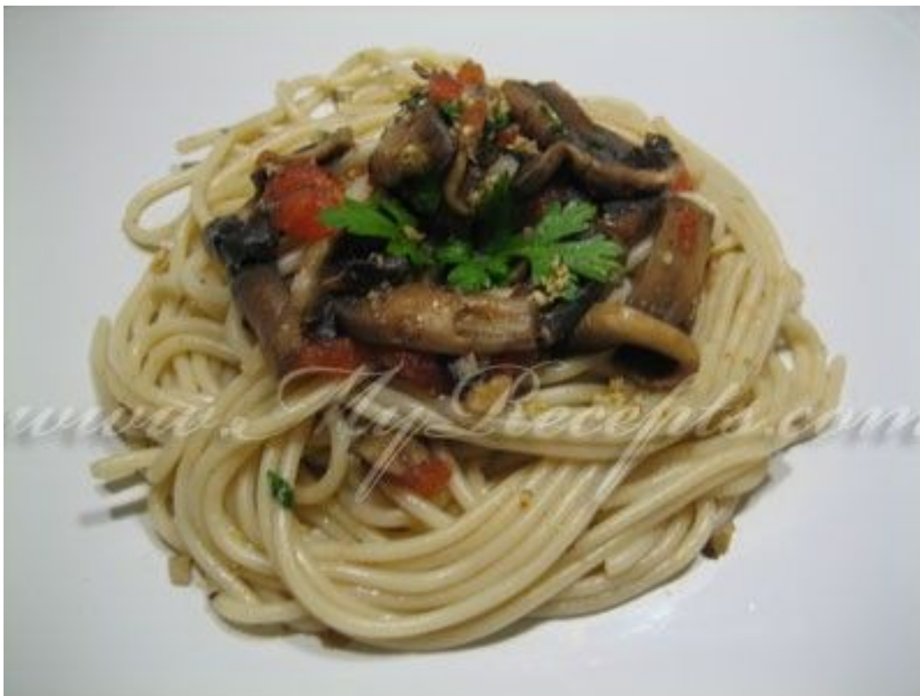
Спагетти с грибами