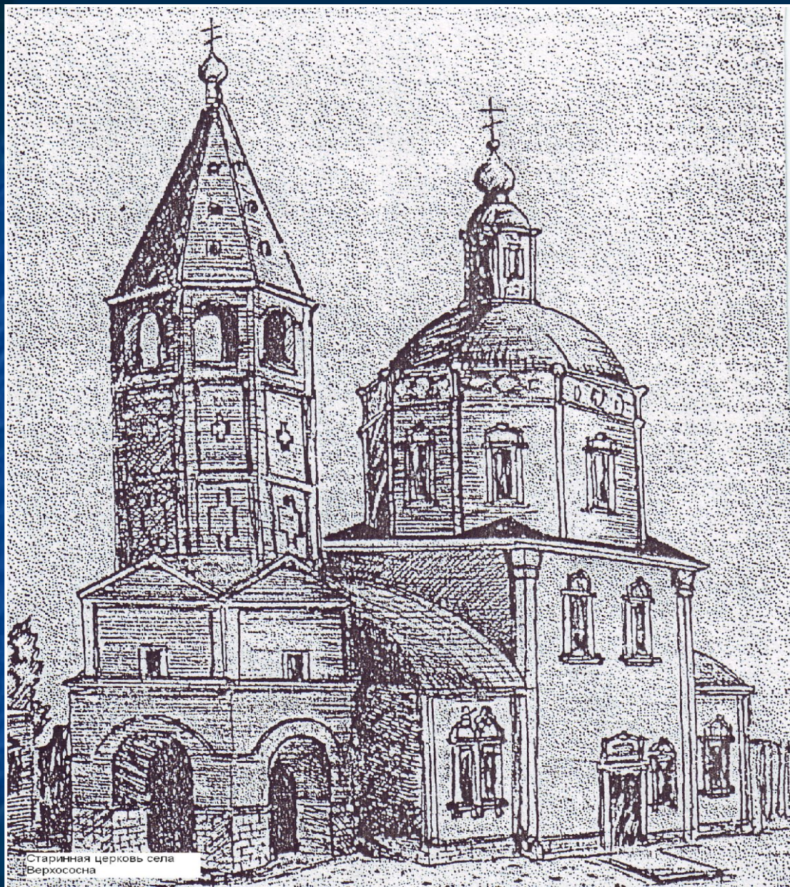
Старинная церковь села Верхососна