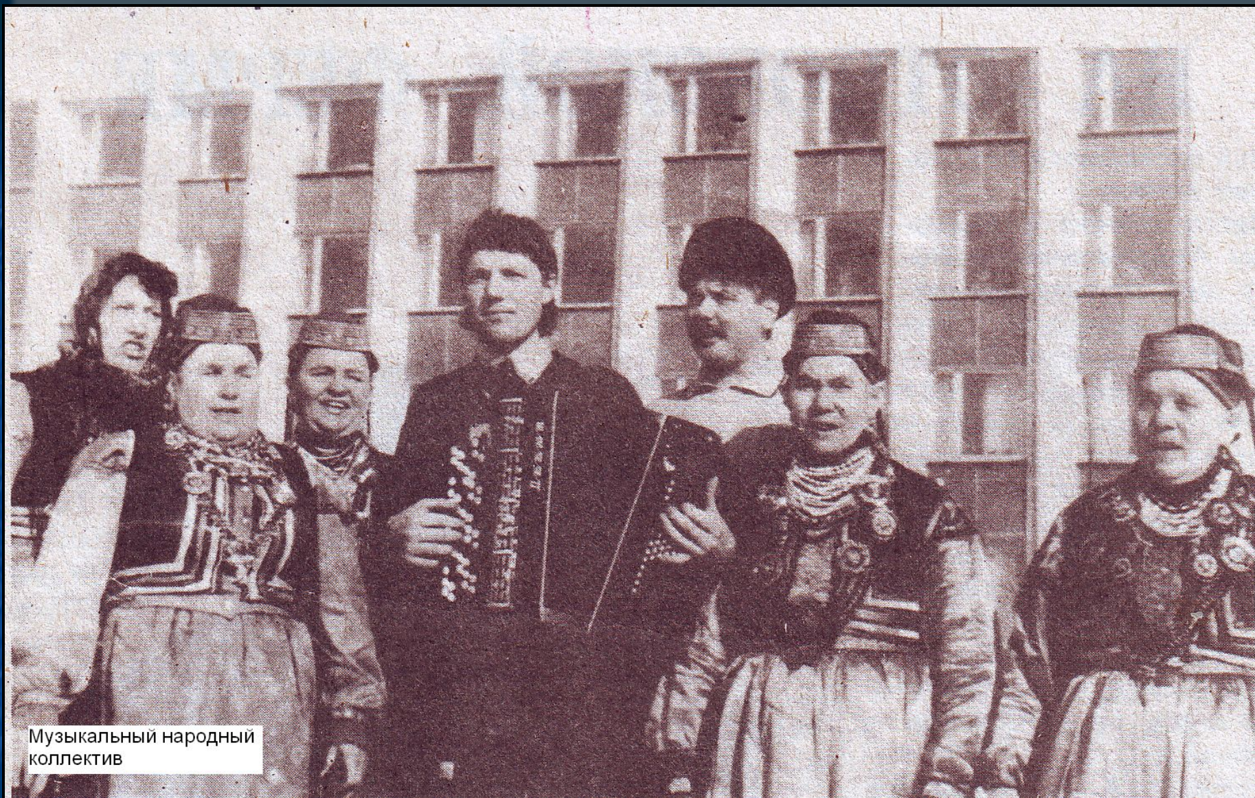
Музыкальный народный коллектив